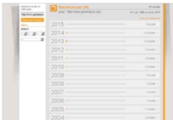
Figure 5 – Présentation des versions disponibles du site Histoire-immigration. fr et Oumma.tv collectées respectivement par l'INA et la BNF. Si, dans ces exemples, la BNF propose dans l'interface de consultation un nombre limité de versions archivées pour l'URL histoire-immigration.fr, chacune d'entre elle donne ensuite accès aux sous-rubriques du sites, décuplant le nombre de pages à dépouiller.

dispositifs mémoriels consacrés à l'héritage colonial dans les archives Web de l'INA au sein du projet Polyvocal Interpretation of Contested Colonial Heritage 15 .