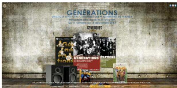
4.b. Site de l'exposition Générations, www.generations-lexpo.fr, version du 20 février 2010, Internet Archive.