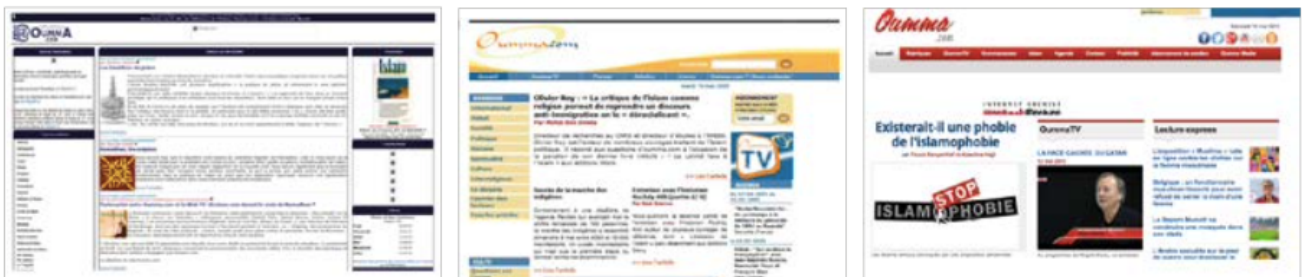
Figure 1 – Oumma.com, du portail communautaire au site d'information musulman (1999-2014). Capture d'écran de la page d'accueil extraite d'Internet Archive. Version 1 : 1999 - 2001 (archive 4 décembre 2000) ; version 2 : 2001-2008 (archive du 10 mai 2005), Version 3 : 2008.

sur des réseaux socionumériques, webdocumentaires, etc.) et émanant d'actrices et d'acteurs variés, depuis l'internaute jusqu'à l'institution muséale.