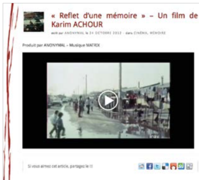
Figure 3 – « Reflet d'une mémoire », http://www.memojas.org/musee/?p=53317.10.61 , 24 octobre 2012, Internet Archive.