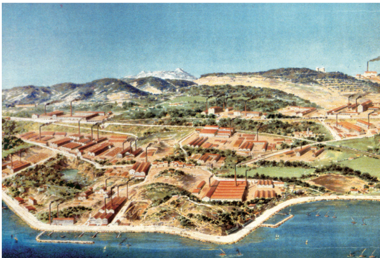
Détail d'un calendrier de la Société Générale des Tuileries de Marseille, 1905. © Collection de la CCIAMP - QAF 0521 - photographie François Jonniaux

Plus discrète que celle du savon, la production de tuiles, briques et carreaux n'en a pas moins été une industrie déterminante dans le rayonnement international du port de Marseille.