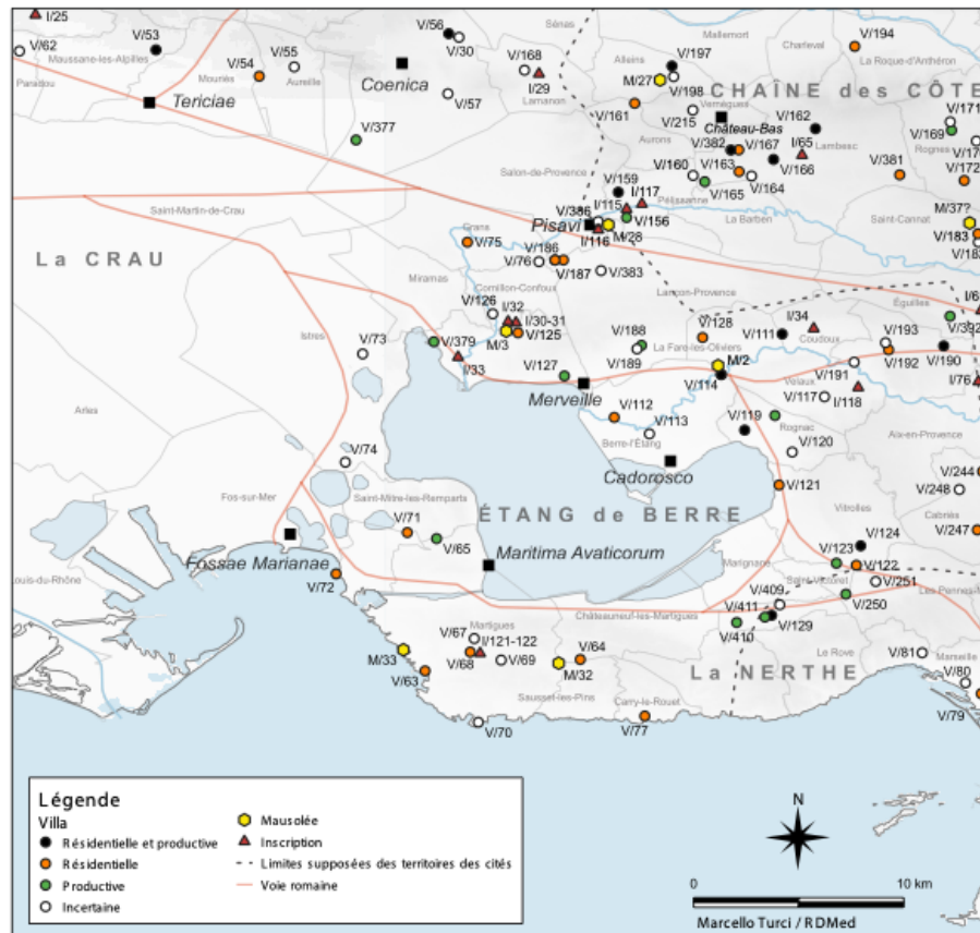
Fig. 4 : Les villas des rives de l'Étang-de-Berre.