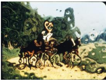
Photogramme issu de l'un des derniers plans du film

Cette ambiguïté de la fonction figurative du mouvement apparaît d'abord par la fluence des formes mobiles, l'épanchement ou la concentration de leurs limites dans l'espace. Bouger, c'est se transformer, changer d'apparence tout en restant identique. L'identité est constituée par la corrélation d'attributs comme la forme du mouvement lui-même, certaines valeurs colorées – qui, si elles peuvent disparaître, ne peuvent être remplacées complètement par d'autres – et une forme de gradation de la présence qui, même « invisible » un instant, réapparaît ensuite ou signale son « existence ». Complexe métabolique – au sens grec du terme μεταβολη –, la forme se déplace et se transforme, elle flue et, dans le film, modifie ses relations avec l'entour xiii par une sorte d'interpénétration ou de fusion partielle et éphémère avec les teintes voisines du fond. Les limites de la forme fluente peuvent ainsi apparaître comme un lieu de passage possible, une forme d'enveloppe « franchissable ».