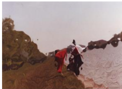
Photogramme d'Au bord du lac et photographie de Patrick Bokanowski

Dans les plans mobiles, ces transformations des intensités colorées, donc des limites perdurent, mais l'espace devient un lieu dynamique, structuré entre autres par les formes qui s'y déplacent et auxquelles la mobilité donne une valeur démarcative par rapport au fond – nous le verrons dans le chapitre suivant. Cette mobilité est facteur de transformation spatiale, de disjonctions, mais aussi de décomposition, de fluence eidétique, car les limites des formes mobiles varient et celles-ci se « déforment », voire même disparaissent pour réapparaître ensuite sur la même trajectoire – la conservation de la trajectoire apparaît ainsi comme un des éléments définitionnels des formes qui semblent des mobilités de contrastes colorés plus ou moins étendus.