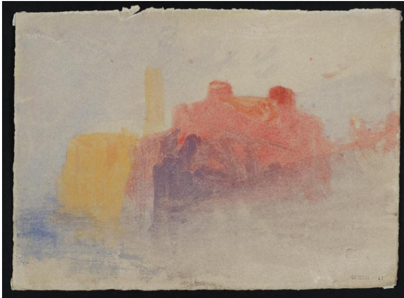
Fig. 5 : Waterside Buildings, ?South of France or Italy c.1834 Joseph Mallord William Turner 1775-1851 Accepté par la nation dans le cadre du legs Turner 1856

Provence en 2016. Le profil supérieur de la page 36 du carnet CCXXIX (D20972), qui représente aussi le fort Saint-Jean encadré par son fanal et sa tour (cf. fig.3 ) m'a permis de proposer l'intégration dans cette même « famille » de l'aquarelle D28935, jusque-là non identifiée et qui présente une étude de couleurs appliquée au fort Saint-Jean vu du même endroit que l'aquarelle D28965.