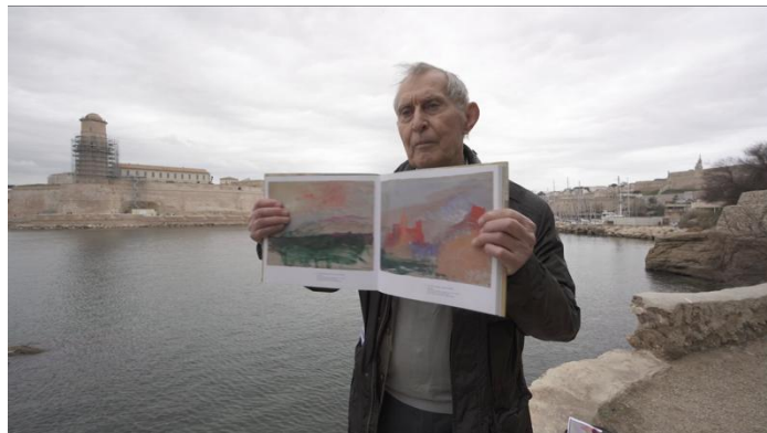
Fig.1 : L'auteur devant l'entrée du port de Marseille

Je vous ai amené jusqu'ici, au goulet du vieux port de Marseille, parce que c'est un endroit idéal pour observer la façon dont le peintre anglais William Turner, au cours de ses nombreux voyages entre la France et l'Italie, a illustré ses pratiques picturales et graphiques. Le site que vous avez sous les yeux derrière moi est celui de l'entrée du port historique de Marseille : à gauche le fort Saint-Jean, au centre le goulet du port, à droite les forts Saint-Nicolas et Entrecasteaux, et par-dessus l'ensemble de Notre Dame de la Garde. Le peintre a dessiné à cet endroit une aquarelle qui est restée longtemps indéfinie, sinon dans son itinéraire générale, du moins dans sa localisation précise.