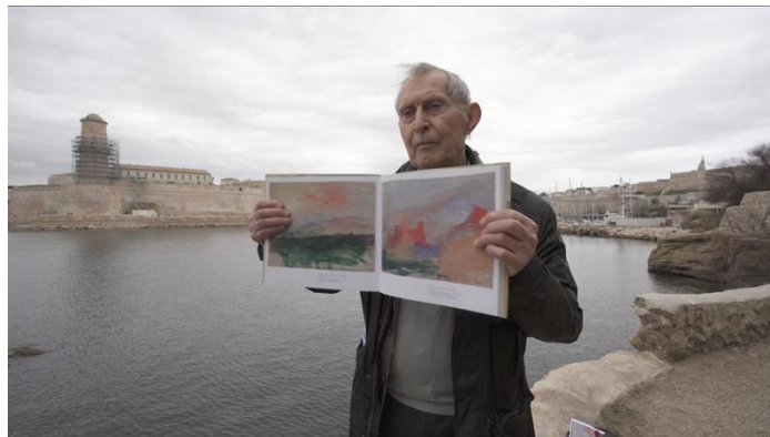
Fig.1 : L'auteur devant l'entrée du port de Marseille

Je vous ai amené jusqu'ici, au goulet du vieux port de Marseille, parce que c'est un endroit idéal pour observer la façon dont le peintre anglais William Turner, au cours de ses nombreux voyages entre la France et l'Italie, a illustré ses pratiques picturales et graphiques. Le site que vous avez sous les yeux derrière moi est celui de l'entrée du port historique de Marseille : à gauche le fort Saint-Jean, au centre le goulet du port, à droite les forts Saint-Nicolas et Entrecasteaux, et par-dessus l'ensemble de Notre Dame de la Garde. Le peintre a dessiné à cet endroit une aquarelle qui est restée longtemps indéfinie, sinon dans son itinéraire générale, du moins dans sa localisation précise.