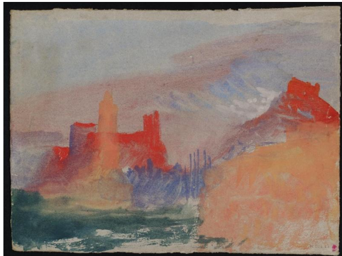
Fig. 2 : Coastal Terrain and Buildings, ?South of France or Italy c.1834 Joseph Mallord William Turner 1775-1851 Accepté par la nation dans le cadre du legs Turner 1856 CC-BY-NC-ND (3.0 Unported) https://www.tate.org.uk/art/artworks/turner-coastal-terrain-and-buildings-south-of-france-or-italy-d28965

L'entrée du port de Marseille vue depuis la rive sud du goulet, face au fort Saint-Jean