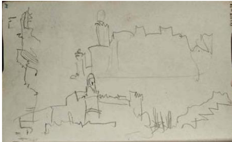
Fig.3 : Fortress 1828 Joseph Mallord William Turner 1775-1851 Tate Londres Accepté par la nation dans le cadre du legs Turner 1856 CCXXIX 36

depuis une dizaine d'années sur les voyages de Turner et ses itinéraires en France du sud-est, en particulier lorsqu'il allait de l'Angleterre à l'Italie, j'ai constaté que, sur le carnet d'un voyage d'Orléans à Marseille ( Legs Turner CCXXIX), le verso de la feuille 36 présente un croquis qui peut correspondre assez bien au panorama que vous avez devant vous.