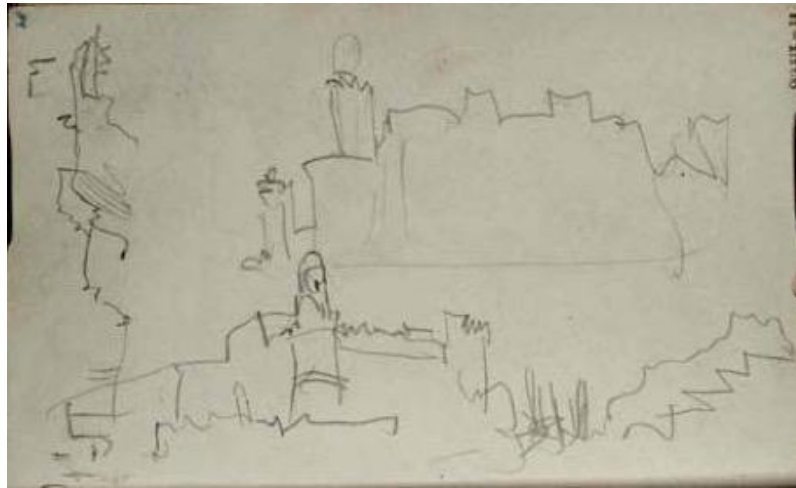
Fig.3 : Fortress 1828 Joseph Mallord William Turner 1775-1851 Tate Londres Accepté par la nation dans le cadre du legs Turner 1856 CCXXIX 36 CC-BY-NC-ND (3.0 Unported)

depuis une dizaine d'années sur les voyages de Turner et ses itinéraires en France du sud-est, en particulier lorsqu'il allait de l'Angleterre à l'Italie, j'ai constaté que, sur le carnet d'un voyage d'Orléans à Marseille ( Legs Turner CCXXIX), le verso de la feuille 36 présente un croquis qui peut correspondre assez bien au panorama que vous avez devant vous.