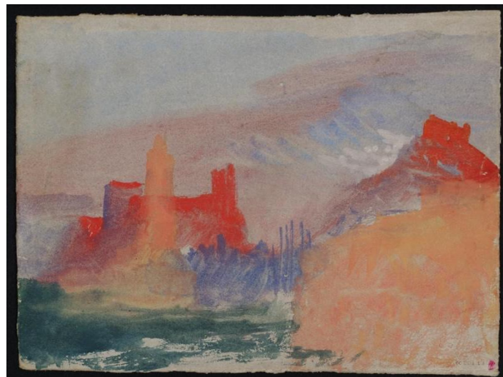
Fig. 2 : Coastal Terrain and Buildings, ?South of France or Italy c.1834 Joseph Mallord William Turner 1775-1851 Accepté par la nation dans le cadre du legs Turner 1856 CC-BY-NC-ND (3.0 Unported) https://www.tate.org.uk/art/artworks/turner-coastal-terrain-and-buildings-south-of-france-or-italy-d28965

L'entrée du port de Marseille vue depuis la rive sud du goulet, face au fort Saint-Jean