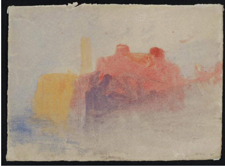
Fig. 5 : Waterside Buildings, ?South of France or Italy c.1834 Joseph Mallord William Turner 1775-1851 Accepté par la nation dans le cadre du legs Turner 1856 CC-BY-NC-ND 3.0 (Unported) https://www.tate.org.uk/art/artworks/turner-waterside-buildings-south-of-france-or-italy-d29018

Provence en 2016. Le profil supérieur de la page 36 du carnet CCXXIX (D20972), qui représente aussi le fort Saint-Jean encadré par son fanal et sa tour (cf. fig.3 ) m'a permis de proposer l'intégration dans cette même « famille » de l'aquarelle D28935, jusque-là non identifiée et qui présente une étude de couleurs appliquée au fort Saint-Jean vu du même endroit que l'aquarelle D28965.