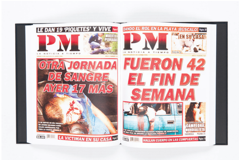
Fig. 6. Teresa Margolles, PM2010 (Livre), 2012. Livre imprimé sur papier, étui. Livre d'artiste qui compile les images des couvertures du journal PM de Ciudad Juarez, Mexique, publié en 2010. Livre : 30 x 36 cm. Étui : 32,5 x 38,5 cm. Avec l'aimable autorisation de l'artiste et de la Galerie Peter Kilchmann, Zurich.

a 'Federal' », « La destrozán con piedra y le pasan auto 36 ». Contrairement aux faits-divers narrés par les textes accompagnant les gravures de Posada un siècle plus tôt (voir Figures 1, 2 et 3), aucun nom ou adjectif ne produit d'appréciation morale du crime. Les seules appréciations émises concernent la quantité d'assassinats : « Ayer sólo hubo dos homicidios 37 ». L'utilisation récurrente de la troisième personne du pluriel rend compte de l'indétermination qui entoure les auteurs et de la focalisation de la nota roja sur les évidences matérielles du crime, au détriment des informations permettant de les contextualiser. Les victimes ne sont jamais nommées et leur visage demeure non reconnaissable et souvent non visible. L'anonymat préside à la représentation des assassins comme de leurs victimes.