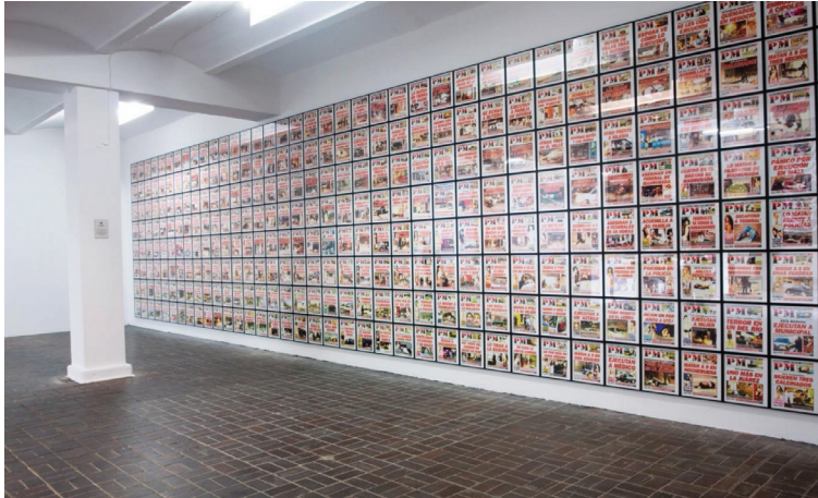
Fig. 4. Teresa Margolles, PM2010 , 2012. Installation. 313 images de couverture du journal PM de Ciudad Juarez, Mexique, publiées en 2010. Dimension pour chacune : 37,2 X 32,2 cm, encadrées. Vue de l'installation : 7 e Biennale de Berlin, Berlin, Allemagne, 2012. Photo : Marta Gornicka. Avec l'aimable autorisation de l'artiste et de la Galerie Peter Kilchmann, Zurich.