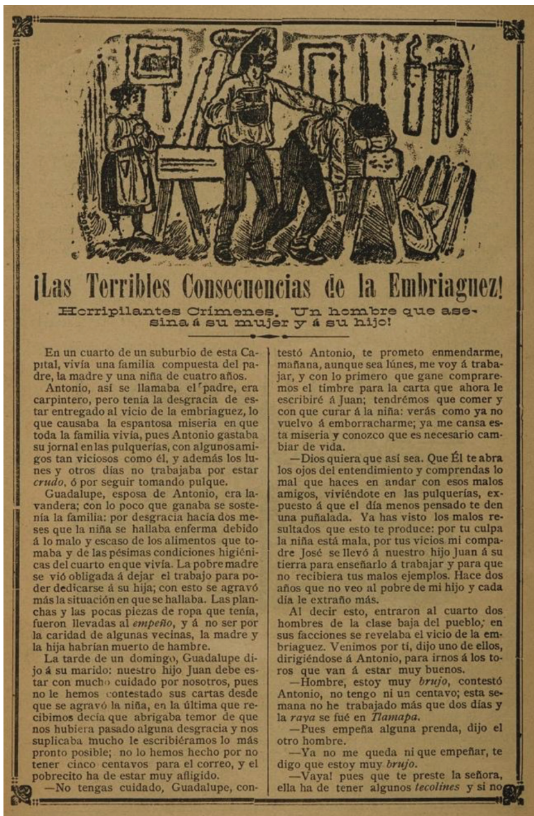
Fig. 3. José Guadalupe Posada, ¡Las terribles consecuencias de la embriaguez! Horripilantes crímenes. Un hombre que asesina á su mujer y su hijo , 1900. Collection : Carlos Monsiviás.