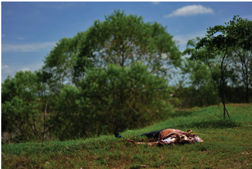
Fig. 10. Fernando Brito, 31 juillet 2010, nord du Mexique. Image issue de la série Tus pasos se perdieron con el paisaje .