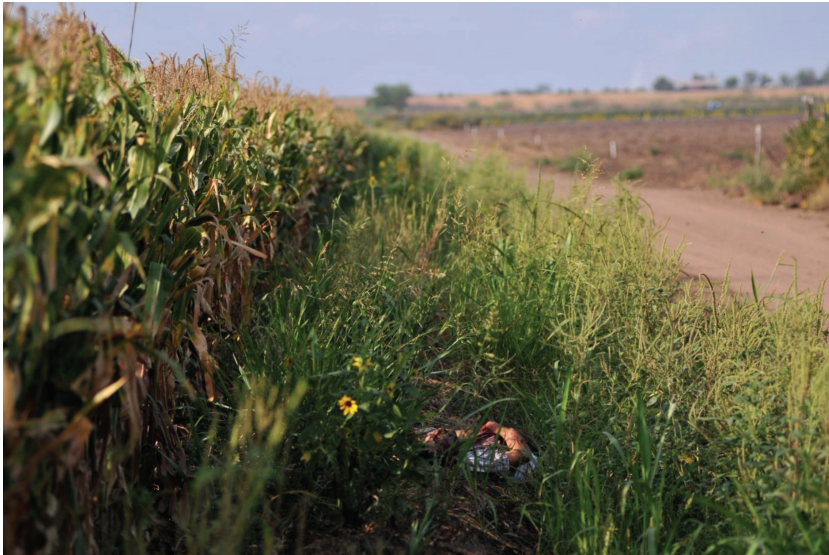
Fig. 7. Fernando Brito, 22 juin 2010, nord du Mexique. Image issue de la série Tus pasos se perdieron con el paisaje (3 e prix du World Press Photo 2014, dans la catégorie « Contemporary Issue, Stories »).

marge des images qu'ils publient dans le quotidien. Intitulée Tus pasos se perdieron con el paisaje 49 , Fernando Brito a constitué cette série depuis les scènes de crime où son travail de journaliste le conduisait. L'inscription du cadavre au sein de l'espace où il a été retrouvé caractérise l'ensemble de ces images (Figures 7, 8, 9 et 10), établissant d'emblée un contraste avec l'esthétique des photographies de nota roja où le contexte est seulement suggéré par quelques éléments génériques (pans de mur, segment de route ou de chemin). L'environnement est ici systématiquement rural et agricole : le ou les cadavres gisent au bord d'un chemin de terre, d'un champ ou d'une rivière. Le format reprend le modèle de composition de la photographie de paysage. Organisée en fonction des règles de la perspective, celle-ci suscite une observation contemplative de l'image, où le regard se déplace, du premier plan et des éléments du paysage – haie d'arbres, chemin, bord de champ, reliefs – organisés dans le cadre, jusqu'à la ligne d'horizon et le ciel vers lesquels ces éléments convergent. Dans certaines images (Figure 7 notamment), la dépouille de la victime apparaît seulement comme un détail, n'interrompant pas le déplacement du regard.