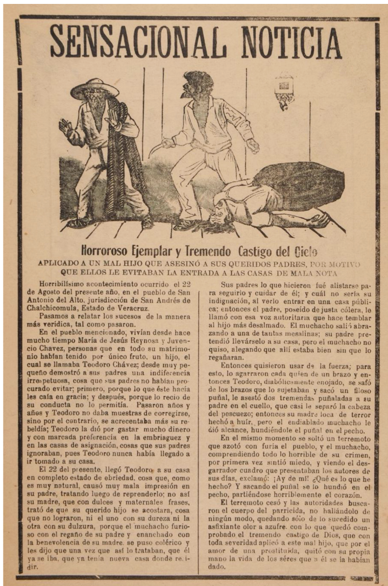
Fig. 1. José Guadalupe Posada, Sensacional noticia, Horroroso ejemplar y tremendo castigo del cielo , 1919. Amon Carter Museum of American Art, Fort Worth, Texas.