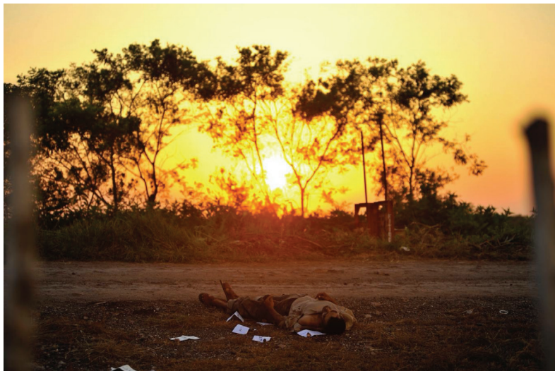
Fig. 9. Fernando Brito, 18 septembre 2010, nord du Mexique. Image issue de la série Tus pasos se perdieron con el paisaje .