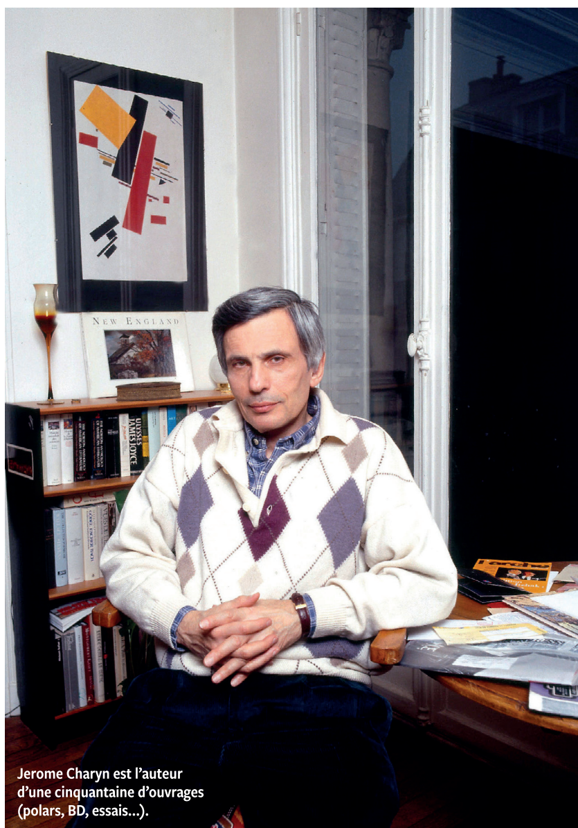
Jerome Charyn est l'auteur d'une cinquantaine d'ouvrages (polars, BD, essais...).

Jerome Charyn a souvent déclaré son amour inconditionnel pour Isaac Babel. Dans l'essai qu'il lui a consacré, Sténo sauvage (2005), il déchiffre les mille vies que ce petit homme au visage banal s'est fabriquées, les masques qu'il a portés, les identités qu'il s'est forgées jusqu'à ce que Staline le fasse secrètement exécuter et que l'écrivain disparaisse ainsi aux yeux du monde, laissant derrière lui une stupéfiante mythologie. Fasciné par cet autofictionnaliste compulsif, Charyn, né en 1937 d'une mère biélorusse et d'un père polonais, a, lui aussi, beaucoup joué avec ses données personnelles, publiant à ses débuts une notice fantasque dans un très sérieux dictionnaire autobiographique et deux romans revisitant sa vie avec humour : dans Poisson-chat (1980), on le voit, enfant puis apprenti écrivain, dans son quartier du Bronx, puisant son inspiration dans le passé européen de ses étranges géniteurs ; dans Le Nez de Pinocchio (1983), on retrouve un certain Jerome Copernicus Charyn que les aventures font voyager dans le temps et transforment en un pantin de bois devenu mascotte de Mussolini dans l'Italie fasciste.