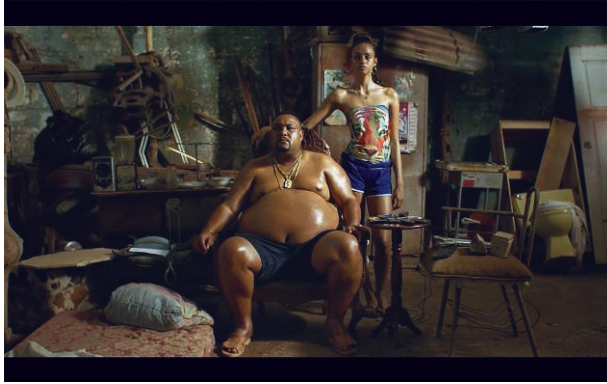
Fig. 8. Candela , de Andrés Farías

Híbrida y polifacética como la realidad que pinta, la película Candela borra las fronteras entre los géneros (el policial y sus subgéneros, el thriller, el melodrama, entre otros), entre las artes y formas expresivas 14 o entre los espacios y culturas (su visión transcaribeña). Partiendo del molde policial bastante tradicional de la investigación de un crimen, abre, como la novela que adapta, hacia una reflexión política y social pero sobre todo plantea un cuestionamiento identitario sobre el Caribe entero, que Farías comparte con su generación del Manifiesto Caribe Pop :