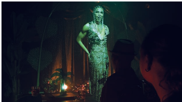
Fig. 1. Candela , de Andrés Farías