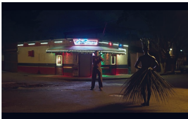
Fig. 7. Candela , de Andrés Farías

En el noticiero pronosticaron vientos de hasta 120 kilómetros por hora. Pero no habrá nada por lo cual preocuparse. El huracán se va a enamorar de nosotros, porque somos gente muy alegre y muy simpática. ¿Cómo no va a serlo, cómo no se va a pasar un rato? En la tarde, el río Ozama se desbordará, arrasará con todo y habrá miles de desaparecidos, porque esta isla tiene que higienizarse de vez en cuando, compañeros. El sol saldrá después de la tormenta, para calentar a los sucios, a las putas, a los bugarrones, a los marihuaneros, a los sidosos, a los que nos cagamos de miedo frente a los cubículos de migración... ¡a todos los hijos de puta! Y al final habrá sol para todos. Es una promesa. Y habrá domingos llenos de luz y de cerveza, porque debemos olvidar todo lo que hemos pasado... Ay, con permiso de los muertos, que desde el cielo de los ahogados, se van a morir de envidia de que la vida siga 12 .