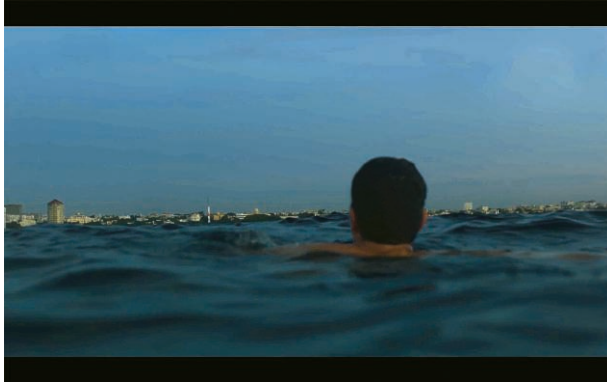
Fig. 6. Candela , de Andrés Farías

fantástico y onírico a la vez. Andrés Farías estima que el capítulo entero de Pérez es un sueño 11 , y no solamente la secuencia onírica de la inundación repentina e inexplicable de su casa.