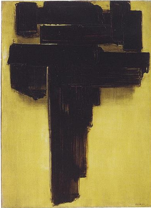
Figure 1. Peinture 81 x 60cm, 6 janvier 1957 (huile sur toile).