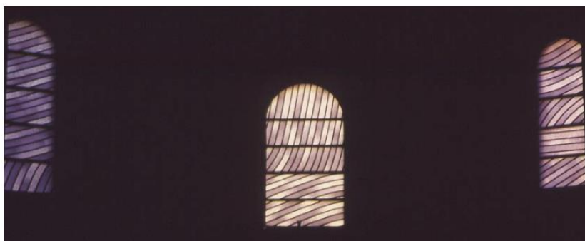
Vitraux de Sainte-Foy de Conques, 1994