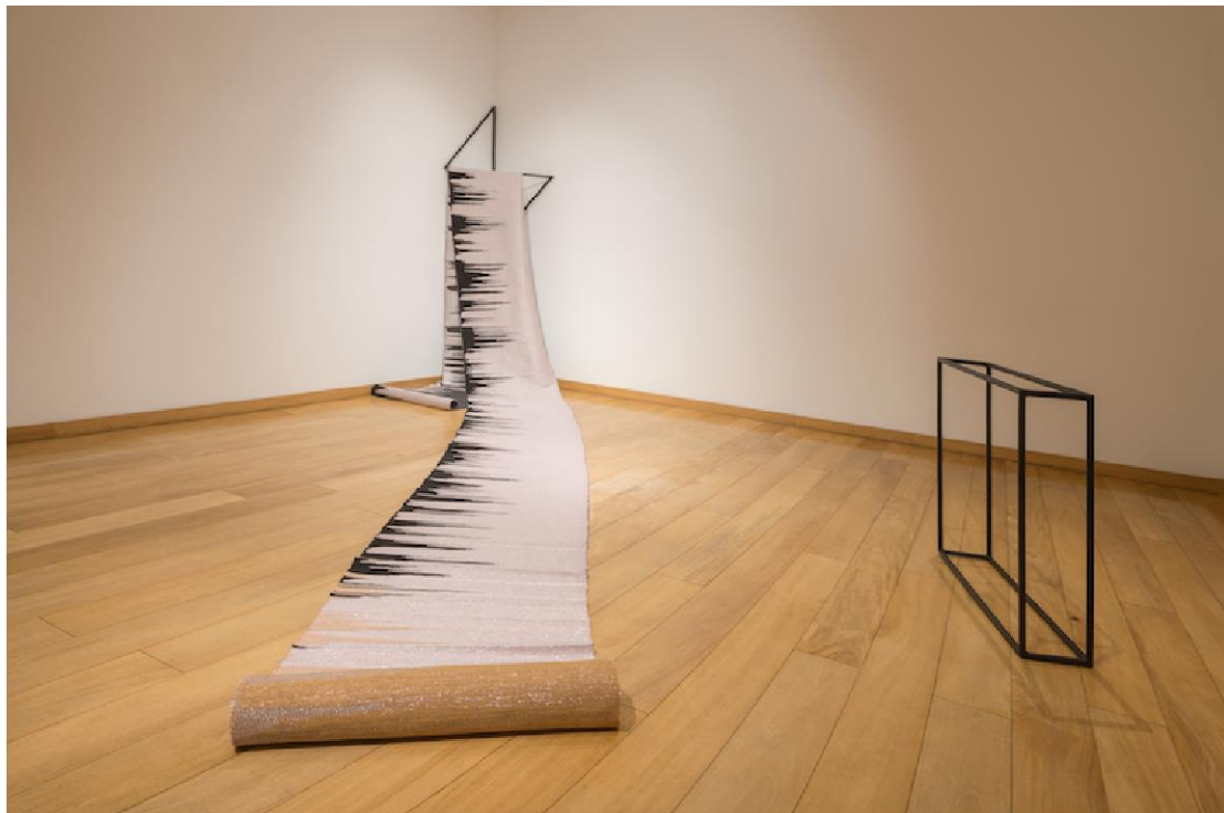
“El tejido hablado”, exposición de Tamar Guimarães, 2019.

durante meses sobre los artefactos arqueológicos del museo, y sobre lo que se puede saber de ellos. Las conversaciones se plasmaron en este tejido, que documenta el proceso, y cuyo patrón se basa en la representación gráfica del sonido de una de aquellas conversaciones. Al hablar sobre las obras precolombinas, los interlocutores hicieron uso de un psicoactivo, provocando un estado alterado de consciencia. Si bien, este aspecto no es visible en la obra, constituye un elemento de análisis no menos importante, puesto que hace referencia al uso de sustancias medicinales en las sociedades precolombinas y en ciertas sociedades originarias del presente, mediante la preparación de plantas consideradas sagradas como la ayahuasca, la coca, la wilca y la flor de guanto.