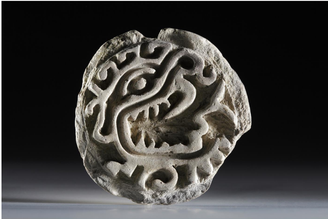
Sello, Sellos planos y cilíndricos, Cultura Manteño Huancavilca (600 - 1532 d.C.), Museo de Arte Precolombino Casa del Alabado