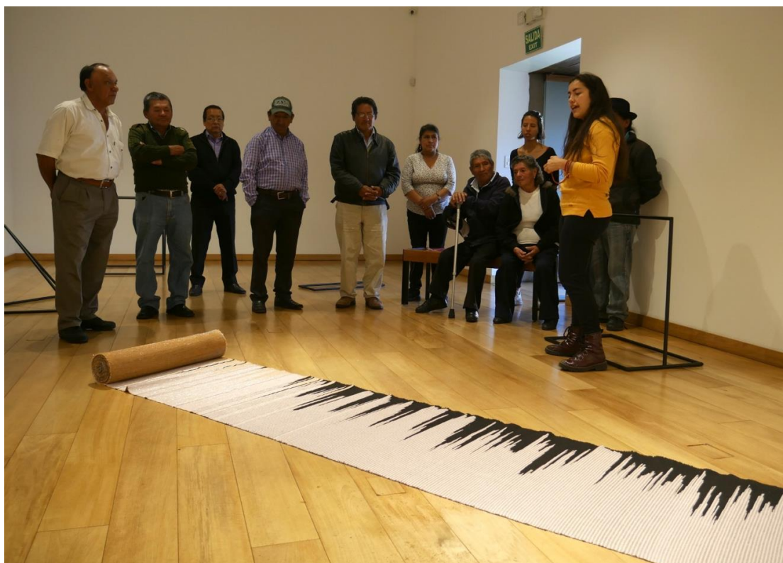
Mediación con la comunidad de “El tejido hablado”, exposición de Tamar Guimarães, 2019.

¿Cómo se entiende el patrimonio cultural desde su plasticidad? ¿En qué medida el museo es un espacio metamórfico, en que diversas dimensiones de su patrimonialidad se activan a través de su mediación?