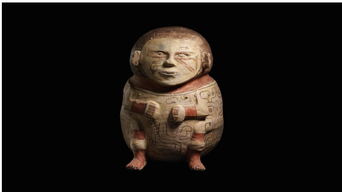
Urna funeraria de la Cultura Napo, (1110-1500 d.C.), Museo de Arte Precolombino Casa del Alabado