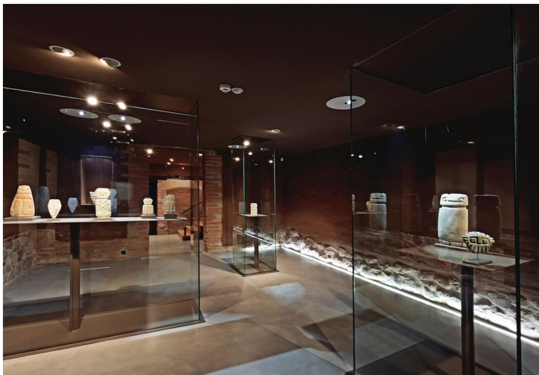
Sala del Museo Casa del Alabado

Con el fin de entender estos procesos, se propone observar la compleja relación socio-simbólica, que existe en la mediación como proceso de transmisión de conocimientos, de aproximación a los significados, de interpretación de lenguajes intraducibles, pero también de especulación. A través del guión sobre aquello que es traducible y aquello que no, intentaremos entender las relaciones que se tejen entre los sujetos y el arte, entendido como parte del patrimonio cultural, replanteando los esquemas de fabricación y circulación del patrimonio cultural.