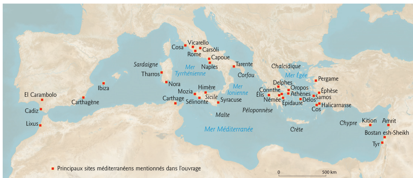
■ Principaux sites méditerranéens mentionnés dans l'ouvrage

and Springs at Syracuse : From Greece to Sicily, elle s'intéresse à deux sources emblématiques du territoire syracusain. Toutes deux ont pour points communs d'être des instruments de la fertilité civique et de la fécondité territoriale au service de l'essor de la cité corinthienne et d'être devenues le sujet de mythes fondateurs pour la culture à la fois locale et panhellénique. Aréthuse, source d'Ortygie, île syracusaine, serait une nymphe d'Artémis venue d'Élide jusqu'en Sicile pour échapper à la fougue amoureuse du fleuve Alphée : elle marquait le cœur de la ville nouvelle. Au contraire, Cyanè, source de la plaine syracusaine, serait une nymphe autochtone qui se serait opposée à Hadès lors du rapt de Koré. Sur ces deux sources, les témoignages de culte, attestés pour l'instant presque exclusivement par les textes, renvoient à de grandes divinités du panthéon grec : Artémis, pour Aréthuse, Déméter et Koré-Perséphone, associées au héros péloponnésien Héraklès, pour Cyanè. L'une instaure un lien éternel entre le Péloponnèse et la Sicile et identifie les nouveaux venus comme des éléments de la Koinè hellénique. L'autre intègre les Grecs dans la société indigène. Toutes deux tissent ainsi les contours d'une société originale et d'une histoire métissée, tout en rappelant les liens de parenté avec Corinthe où les sources étaient également des témoins de l'identité civique.