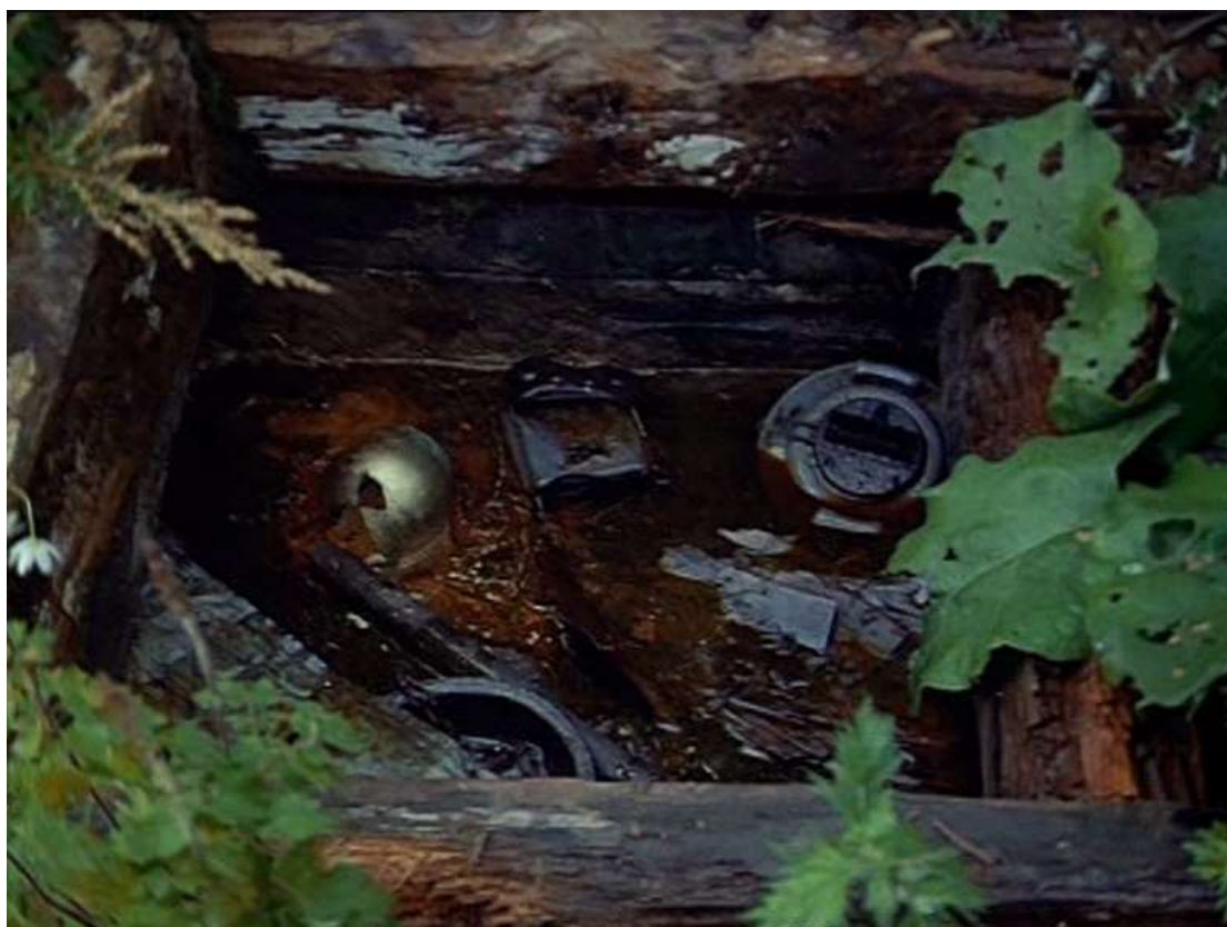
Fig. 8 Andrei Tarkovski Le Miroir 1975