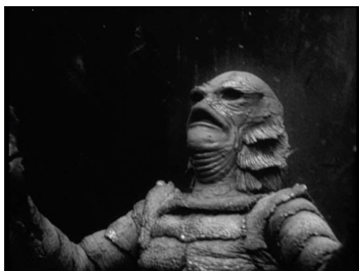
Fig. 5 Jack Arnold L'Étrange Créature du lac noir 1954

À bien y regarder de plus près, il ne s'agit pas d'une cigarette comme une autre, mais d'une cigarette dont le déchet est saisi depuis l'option optique de l'être voyant le plus proche de la nature , presque un animal, en tout cas pas un consommateur de nicotine. C'est une cigarette filmée depuis une perspective éco-logique puisque le film met l'accent sur l'idée que la vision est elle-même une relation écologique (au sens de l'« affordance » de J. J. Gibson : tel milieu invite à telles perceptions et telles actions), notamment par le truchement de l'insistance, dans le récit comme pendant le tournage (costumes de couleurs différentes, caméra aquatique, etc.), sur le médium de l'eau. « Les objets de l'expérience – écrit Emmanuel Alloa dans son introduction à Chose et médium de Fritz Heider – pour autant qu'ils soient des objets d'expérience, ne peuvent pas être complètement isolés, dans une sorte de non-lieu hors de tout. » On ne voit pas dans l'eau comme on voit sur la terre ferme. Vue sous l'eau, une cigarette n'est pas la même chose que la cigarette que l'on fume et dont on use dans l'atmosphère. L'eau – dans laquelle il est impossible de fumer une cigarette – permet ainsi de manifester les conditions nécessaires à un déport spéculatif de notre manière de voir et de concevoir.