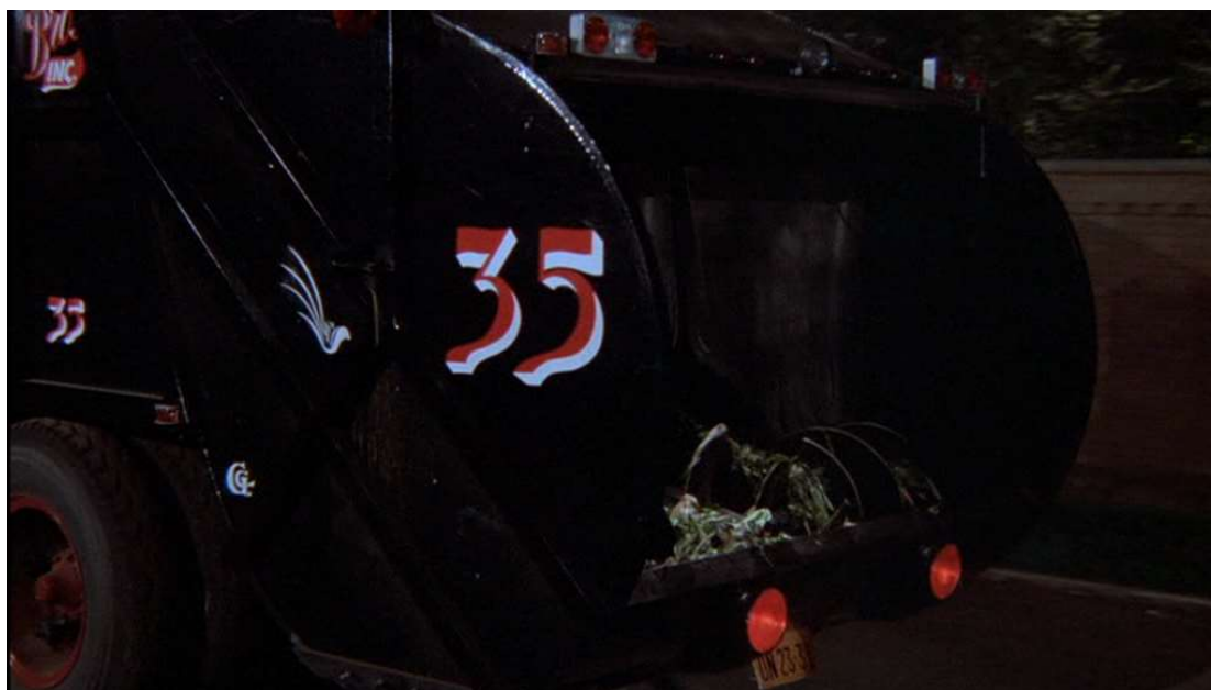
Fig. 4 Sergio Leone Il était une fois en Amérique 1984