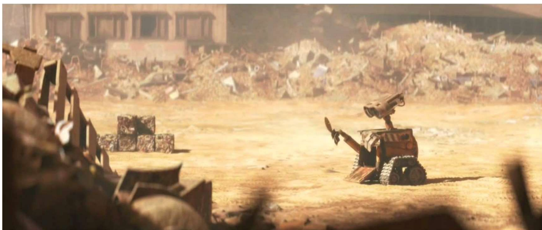
Fig. 11 Andrew Stanton WALL-E