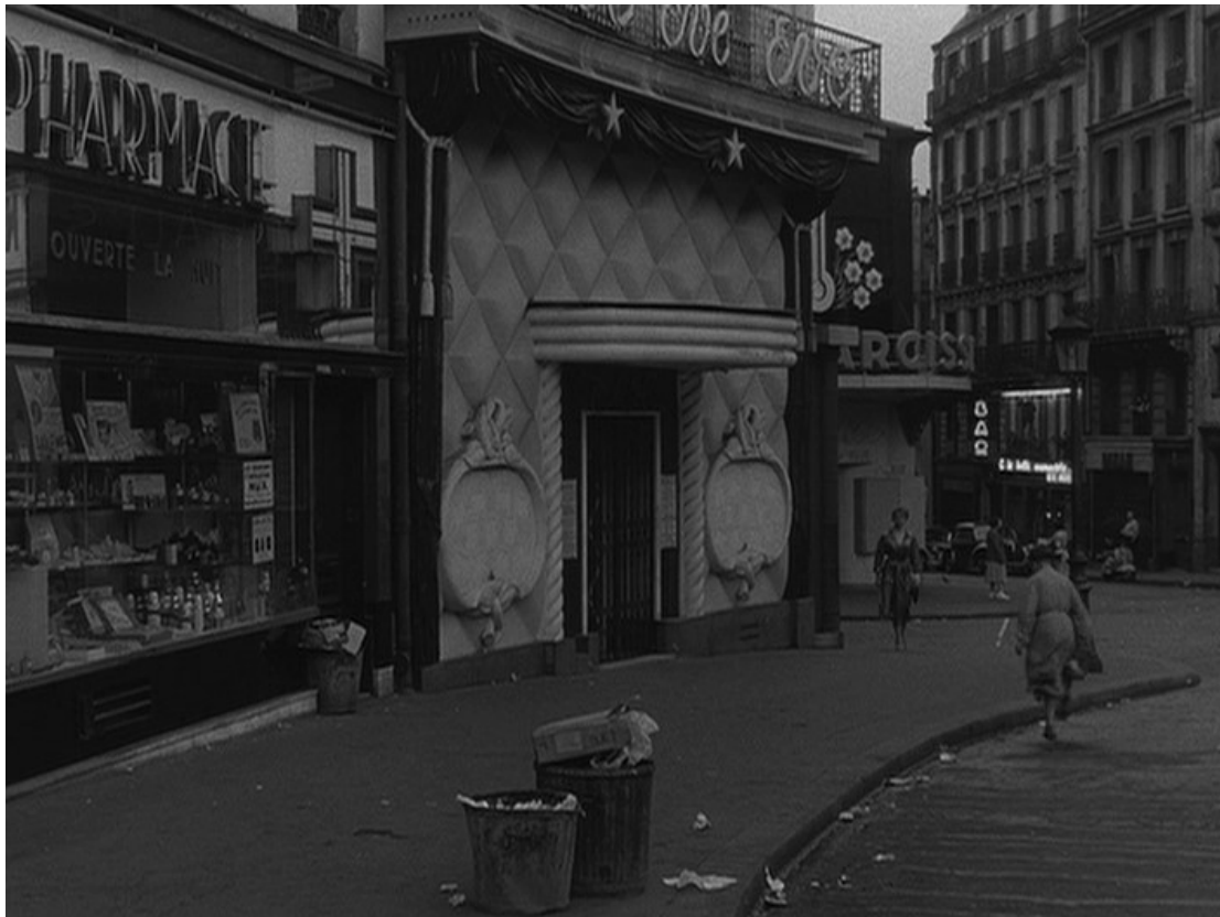
Fig. 10 Jean-Pierre Melville Bob le flambeur 1956

ou le trajet quotidien des travailleurs matutinaux [Fig. 10] ; de l'autre, une fable futuriste écologique en animation de synthèse dans laquelle le dernier robot abandonné sur Terre par une humanité exilée dans l'espace continue sans relâche sa tâche absurde et ingrate de nettoyage d'une planète poubellisée de fond en comble [Fig. 11].