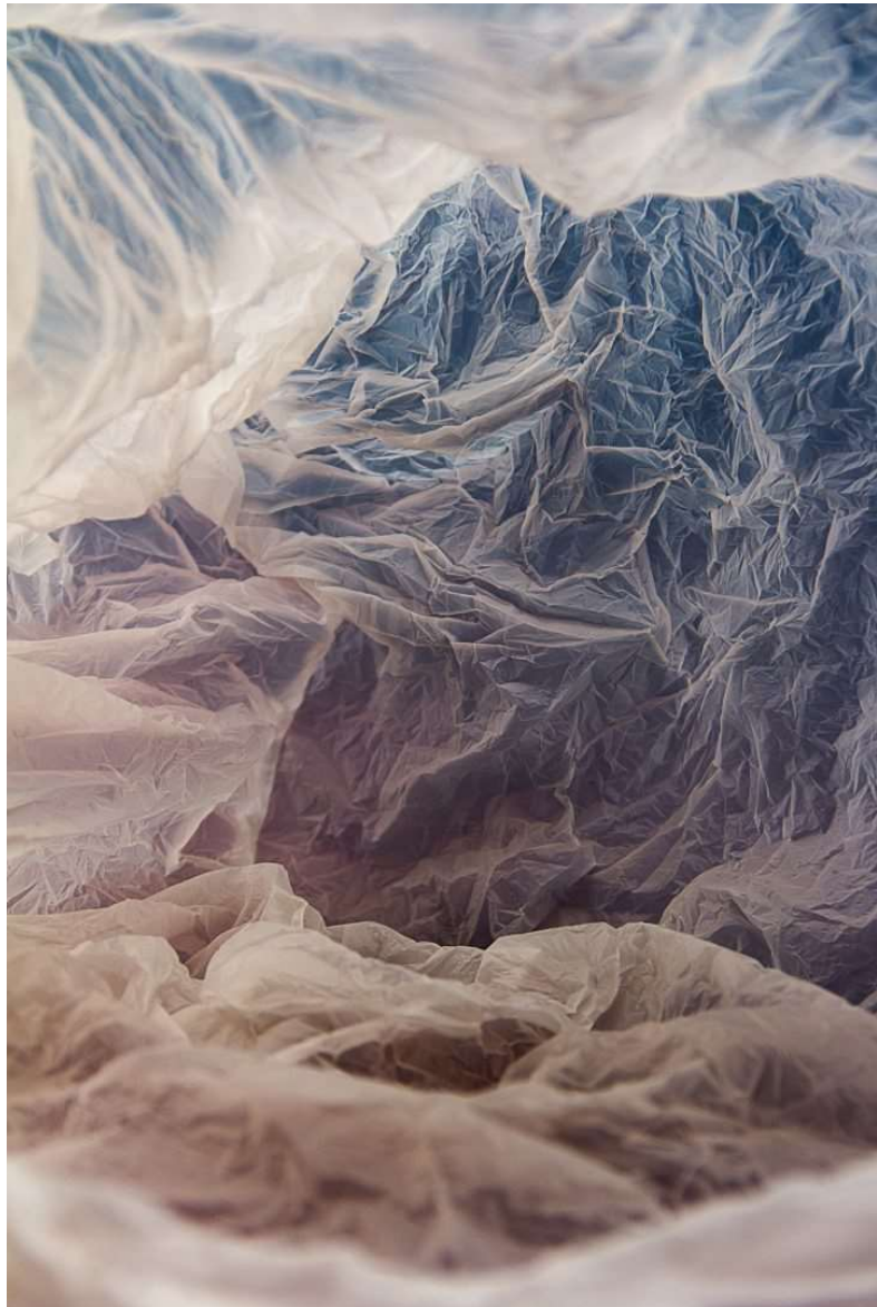
Fig. 1 Vilde J. Olfen Plastic Bag Landscape #1 2014

des siècles. Elle fait de nous des in-cultes et nous désanthropomorphise. Elle nous exclut de notre aptitude culturelle péniblement acquise à voir.