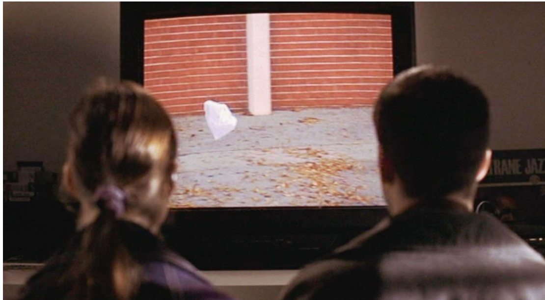
Fig. 7 Sam Mendes American Beauty 1999

Le sac de Mendes tournicote comme un papillon butineur au-dessus d'un champ de fleurs. Il est filmé comme un corps doué d'une vie exclusive.