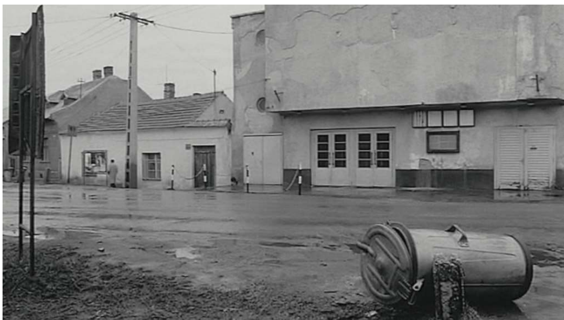
Fig. 9 Béla Tarr Damnation 1988