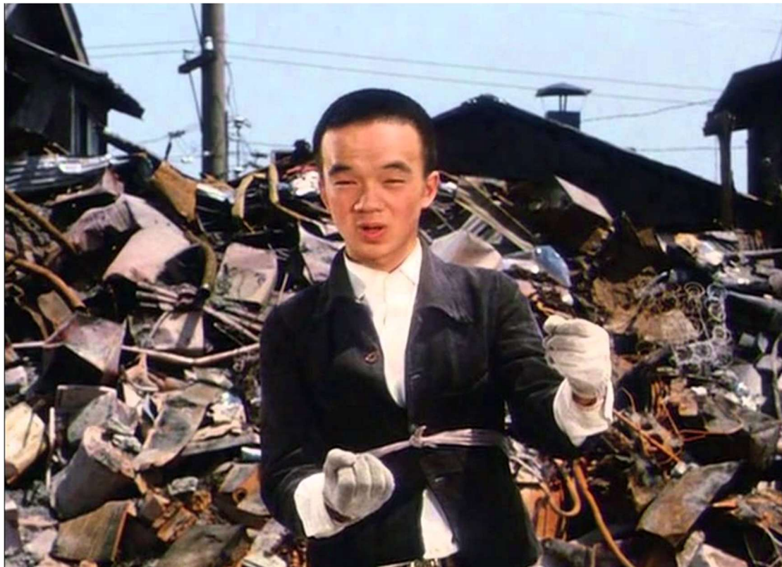
Fig. 3 Akira Kurosawa Dodes'kaden 1970