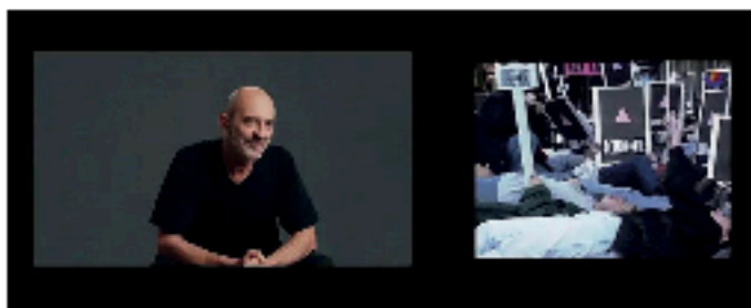
Photogrammes extraits du film Ce n'est pas à proprement parler une épidémie , 2 h 12 min.