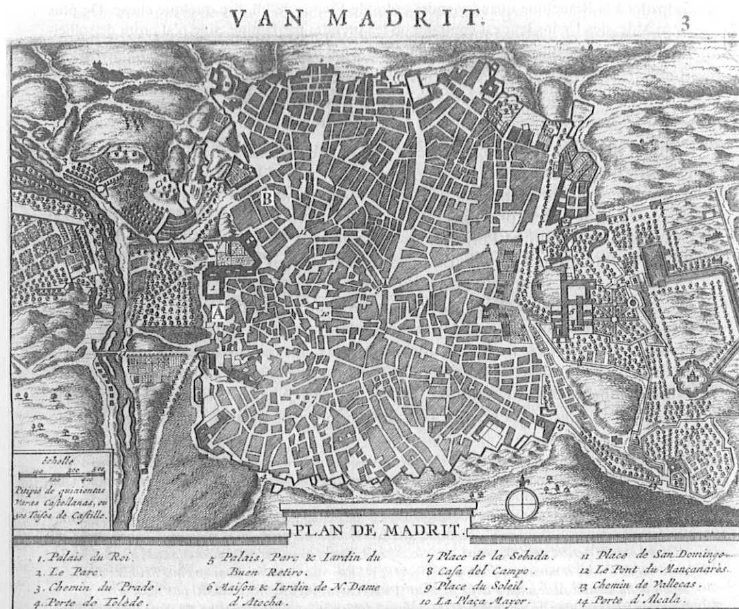
Plan de la ville de Madrid en 1707