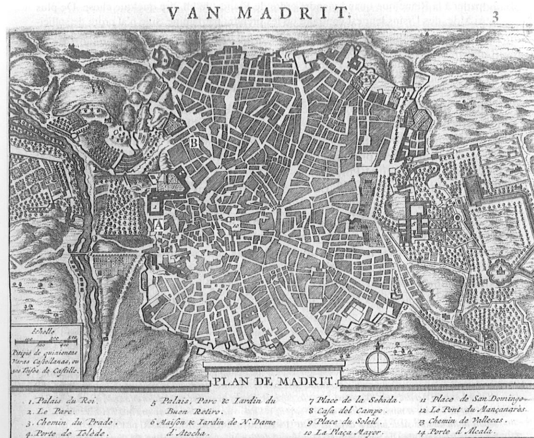
Plan de la ville de Madrid en 1707