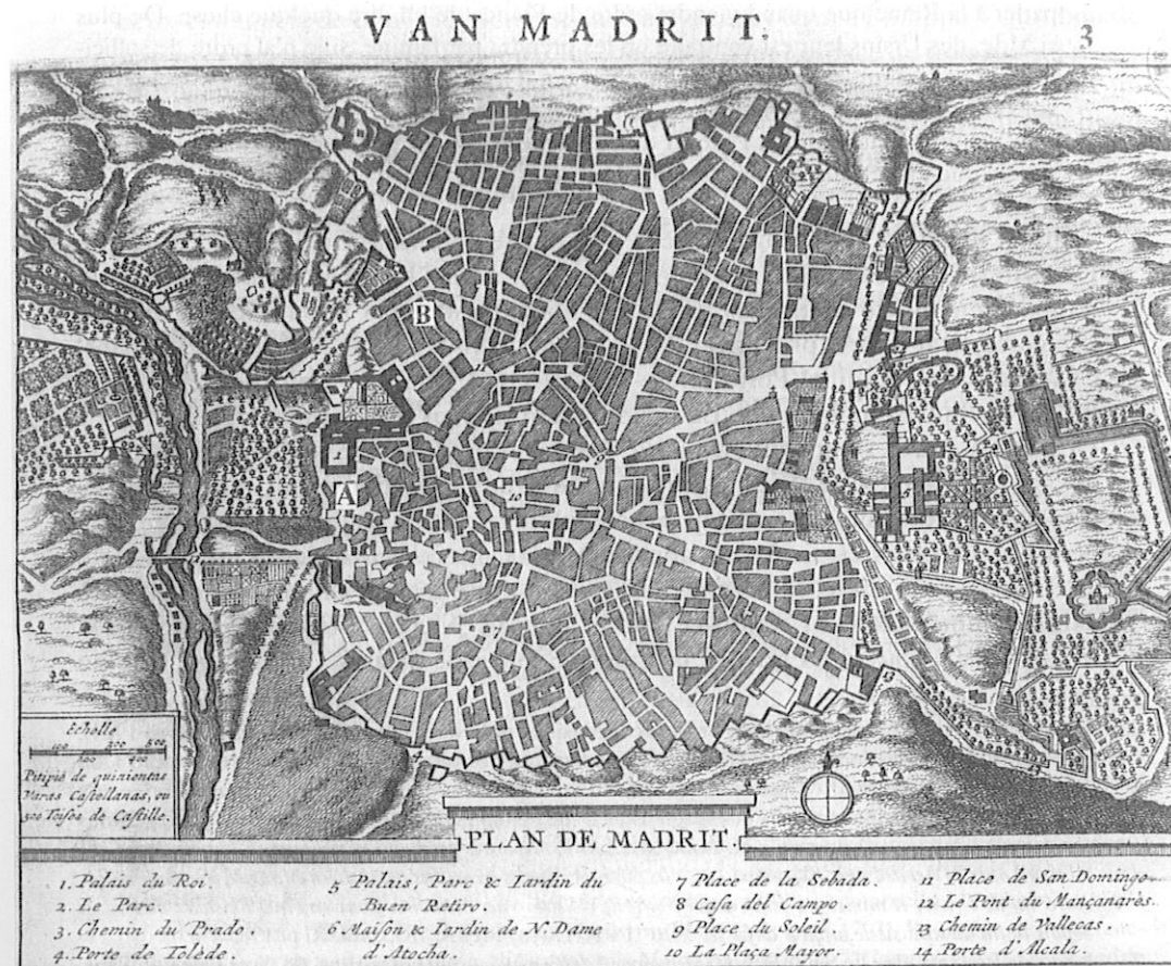
Plan de la ville de Madrid en 1707

(A) Domicile de la famille Desmarest à Madrid