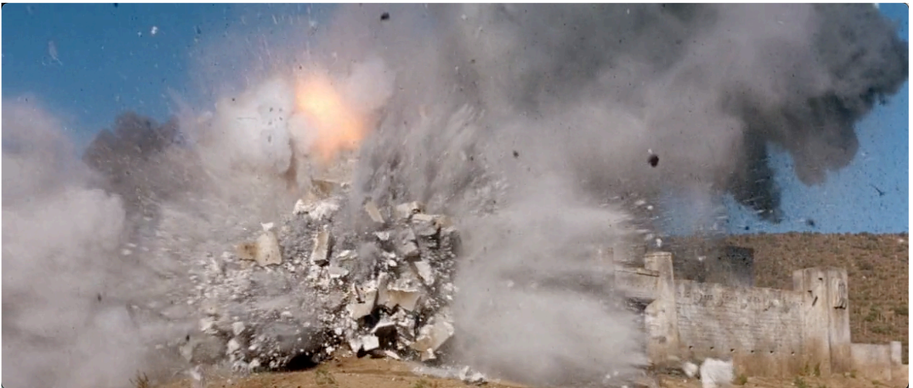
Figure 24. ... a pour effet de l'évincer du tournage.

Drôle, le film est surtout parfaitement maîtrisé et repose entièrement sur un principe subversif annoncé dès le début, extrêmement bien tissé jusqu'à la fin. Tout comme le générique, puis le long travelling sur les jambes de la femme de chambre noire, la destruction du Fort anglais qui ouvre le film est donc programmatique.