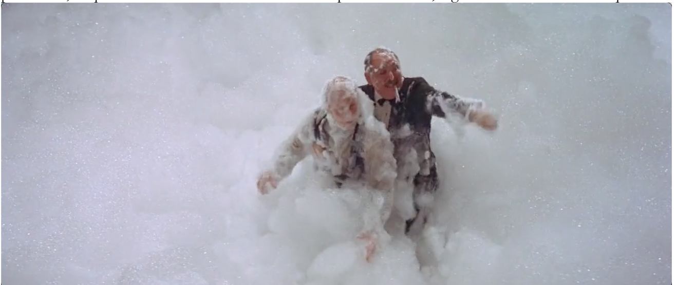
Figure 2. "Save the painting", crie le Général

A travers progressif ce retournement des valeurs, le film progresse d'une société figée quoique à la pointe de la modernité (automobiles, domotique...) vers une société anarchique et chaotique dans laquelle les anciennes valeurs [représentées par les tableaux que le producteur hollywoodien tente de sauver] n'ont plus cours, et qui exulte dans un bain de mousse des plus « techno », digne de soirée de discothèque.