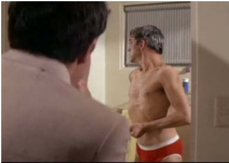
Figure 14. Le maître d'hôtel qui ne cesse de s'en prendre au serveur est aperçu dans les toilettes...