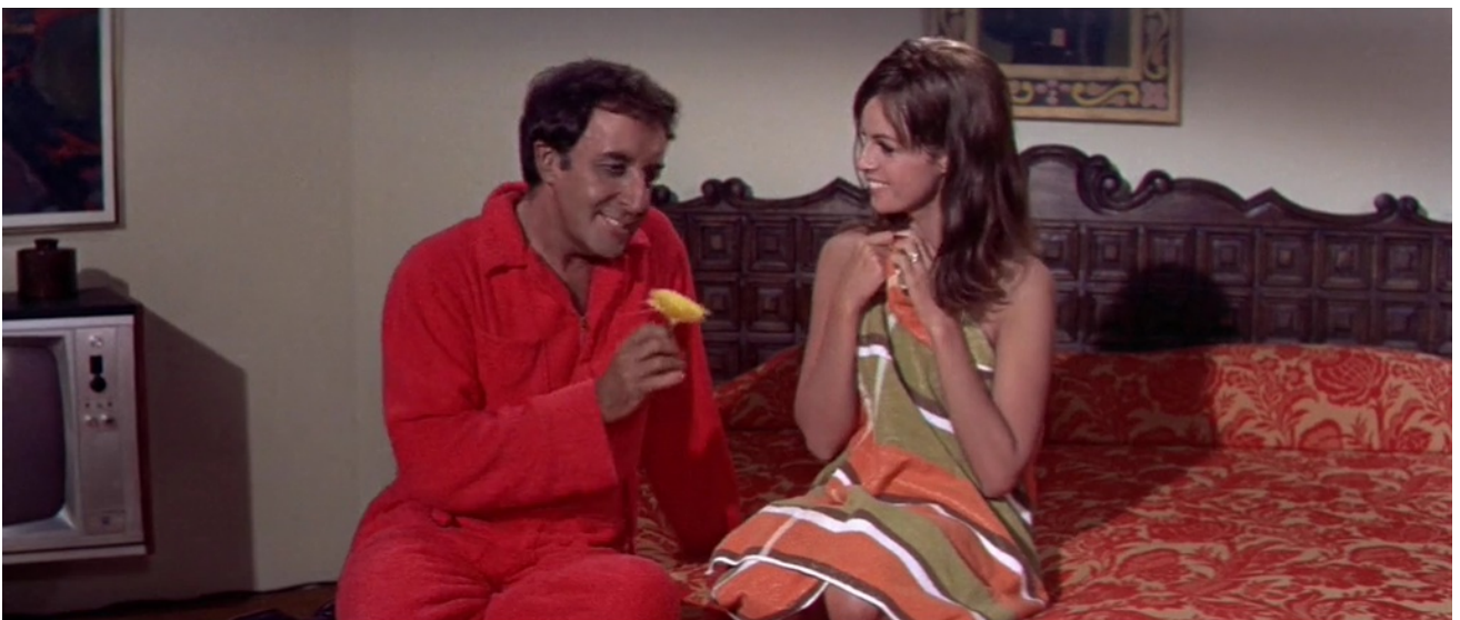
Figure 17. Flower power pour séduire la Française.

A la manière du Persan de Montesquieu, le personnage étranger permet de poser un regard nouveau sur une société figée. Hollywood, bien sûr, mais toute l'Amérique et l'Occident sont bouleversés par le « flower power » de Bakshi, le joueur de sitar.