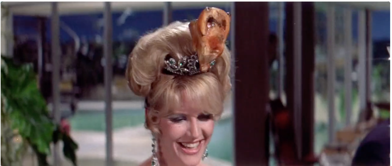
Figure 4. Le volatile est venu se ficher sur le diadème.

En effet, durant tout le film, les scènes se font écho. Ainsi, cette actrice artificielle et hypocrite qui parle dans un premier temps avec le producteur, pendant que Bakshi donne à manger (tente de donner à manger) au perroquet, puis qui fait semblant de trouver une blague drôle durant le repas se retrouve avec le volatile fiché sur sa tiare : c'est définitivement la classer comme « poule ». Au final, tiare et postiche finiront sur le Mannekenpiss .