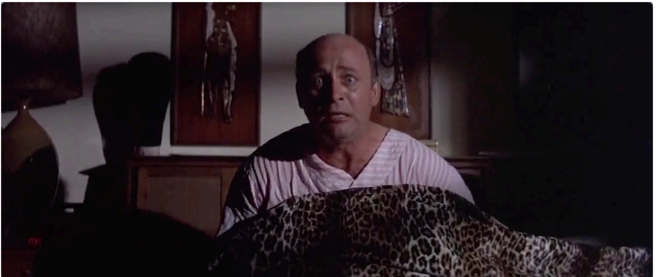
Figure 20. Et c'est à ce moment-là que le producteur Divot le reconnaît du tournage et cela le réveille en un cauchemar. .

Bakshi et l'éléphant sacré qu'il faudra nettoyer : finalement, tout est une histoire d'eau et de purification qui donnera lieu à la grande lessive ; Bakshi, nouvel Hercule, nettoie les écuries d'Augias qu'est Hollywood.