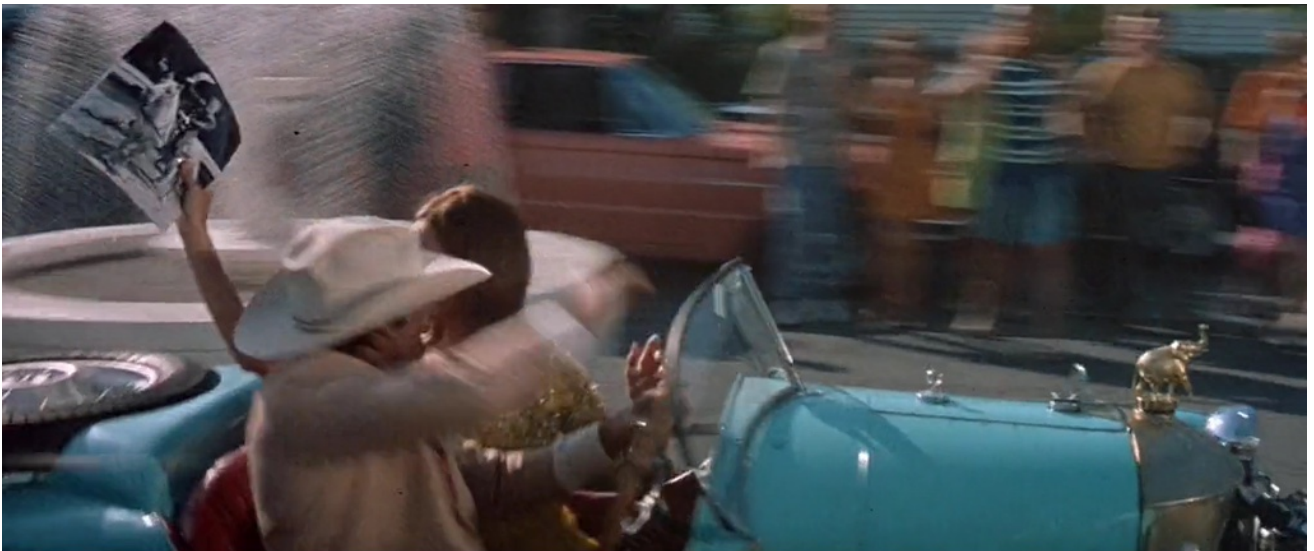
Figure 22. ... qui part avec l'autographe donné du cowboy à cheval.