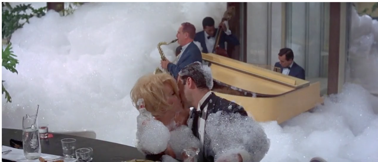
Figure 7. Les deux alcooliques se retrouvent dans la mousse après un tour de passe-passe.

Mais au-delà de ce jeu linguistique et scénique, c'est clairement une invitation à caractère sexuel qui est faite, selon le principe occidental de séduction autour d'un verre d'alcool (puisque le serveur saoul, lui aussi, finira par l'embrasser après une série de tour de passe-passe à trois de la bouteille de vodka).