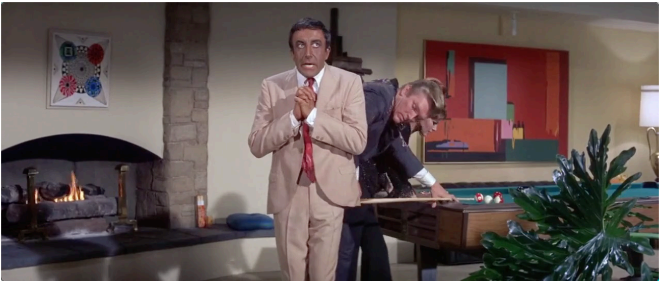
Figure 8. Rencontre du postérieur avec la queue de billard : "Hari Ram Ram"

Se dessine ici, derrière l'allusion sexuelle, l'opposition toute hollywoodienne, cowboy versus indien. « Wyoming » Kelso, dont le surnom est déjà un genre à lui tout seul, se trouve confronté plusieurs fois à l'Indien Bakshi. Et s'il ne s'agit pas tout à fait du même indien que celui des westerns, les allusions sont trop claires pour que le spectateur manque la signification. Ainsi, cela commence par cette rencontre de la queue de billard, établissant clairement la supériorité du mâle Blanc et un peu borné (il ne pense qu'à séduire l'Italienne affamée), cela se poursuivra la revanche - une passe d'armes à la fléchette au cours de laquelle Wyoming n'aura pas le beau rôle et la partie, la belle, se finira par une chevauchée bien allusive qui ne va pas forcément dans le sens genré qu'on attend... En effet, non seulement le puissant cowboy ne séduira pas l'Italienne vorace, mais il sera désarçonné par un Bakshi en slip... sous le regard du « Big chief », le producteur : la scène est donc culturellement et sexuellement codée.