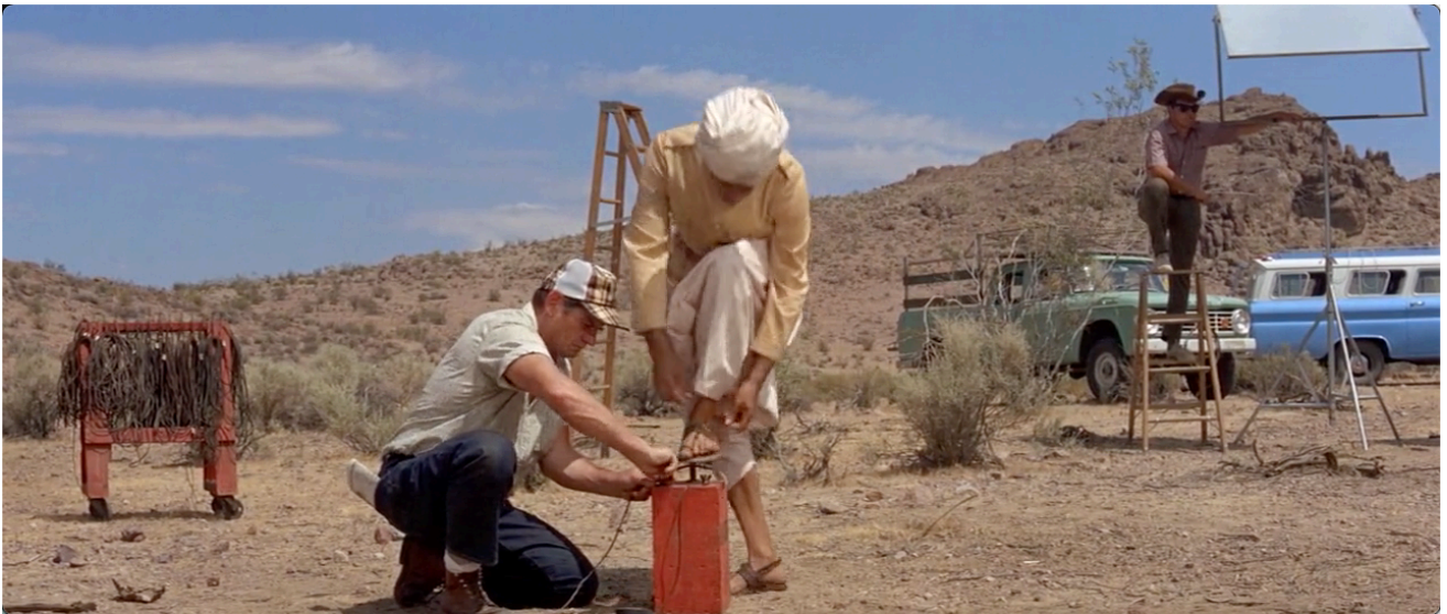
Figure 23. Au début du film, la maladresse de Bakshi...