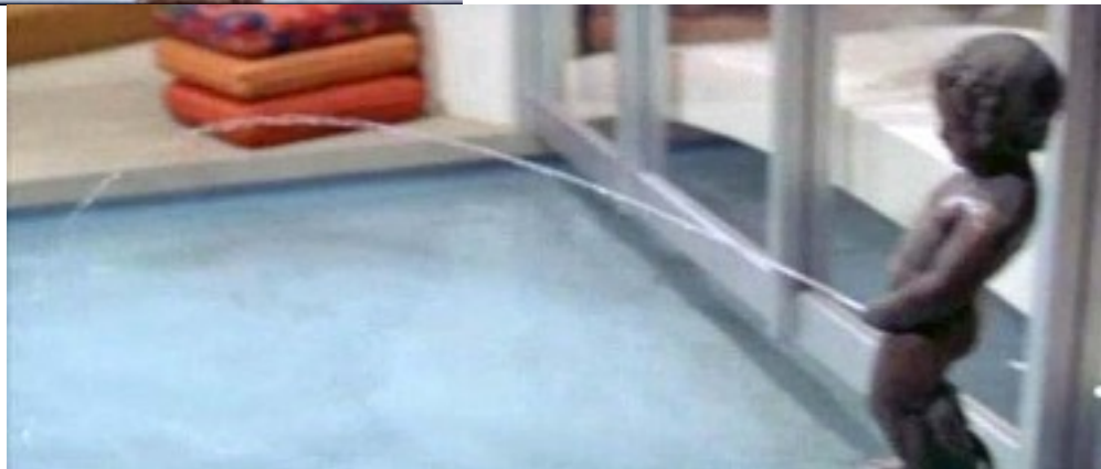
Figure 25. Trois variations sur le Mannekenpiss ...

La relève viendra de l'étranger et de la jeunesse : c'est en effet le jeune fils de la maison qui prête ses vêtements à la chanteuse française, et qui joue avec Bakshi ; ce sont les amis de la fille qui introduisent l'éléphant, symbole de la sagesse, et qui achèvent l'entreprise de destruction commencée par l'Hindou, dans un grand nettoyage de printemps. Pour nettoyer les écuries d'Augias en une journée, Hercule avait détourné le fleuve Alphée ; dans les temps modernes, il revient à l'Hindou Bakshi d'avoir montré qu'en une soirée, avec une chasse d'eau, plus de bonne volonté que de muscles, l'enfer (pavé naturellement de bonnes intentions) pouvait se transformer en paradis... Le Nouveau monde est désormais à l'Est.