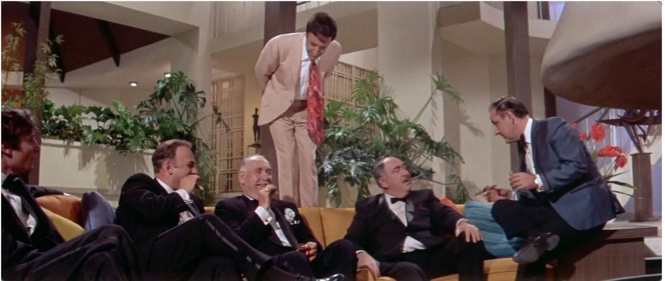
Figure 5. L'opposition culturelle est totale, ici révélée par les codes vestimentaires.