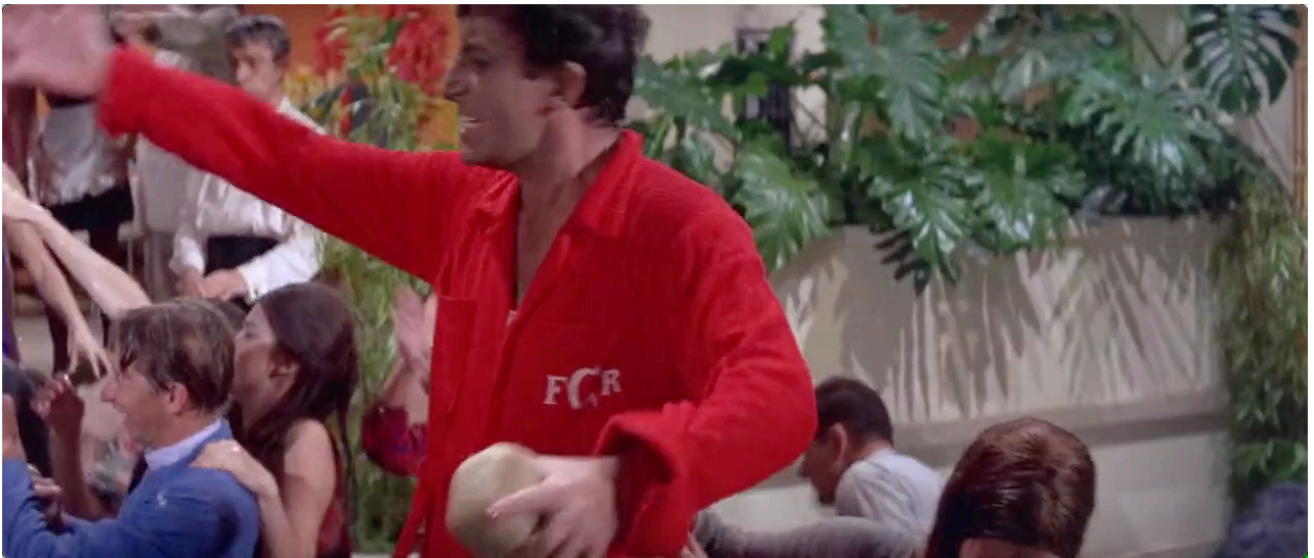
Figure 19. Bakshi se révèle à lui-même et aux autres en leader.