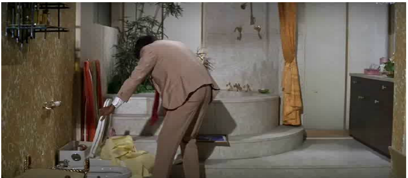
Figure 26. Scène comique, de la chasse d'eau qui ne s'arrête plus de couler.

La relève viendra de l'étranger et de la jeunesse : c'est en effet le jeune fils de la maison qui prête ses vêtements à la chanteuse française, et qui joue avec Bakshi ; ce sont les amis de la fille qui introduisent l'éléphant, symbole de la sagesse, et qui achèvent l'entreprise de destruction commencée par l'Hindou, dans un grand nettoyage de printemps. Pour nettoyer les écuries d'Augias en une journée, Hercule avait détourné le fleuve Alphée ; dans les temps modernes, il revient à l'Hindou Bakshi d'avoir montré qu'en une soirée, avec une chasse d'eau, plus de bonne volonté que de muscles, l'enfer (pavé naturellement de bonnes intentions) pouvait se transformer en paradis... Le Nouveau monde est désormais à l'Est.