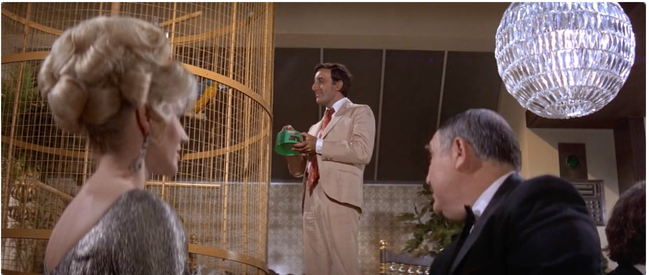
Figure 3. "Birdie Num Num". Notons la position du perroquet...

En effet, durant tout le film, les scènes se font écho. Ainsi, cette actrice artificielle et hypocrite qui parle dans un premier temps avec le producteur, pendant que Bakshi donne à manger (tente de donner à manger) au perroquet, puis qui fait semblant de trouver une blague drôle durant le repas se retrouve avec le volatile fiché sur sa tiare : c'est définitivement la classer comme « poule ». Au final, tiare et postiche finiront sur le Mannekenpiss .