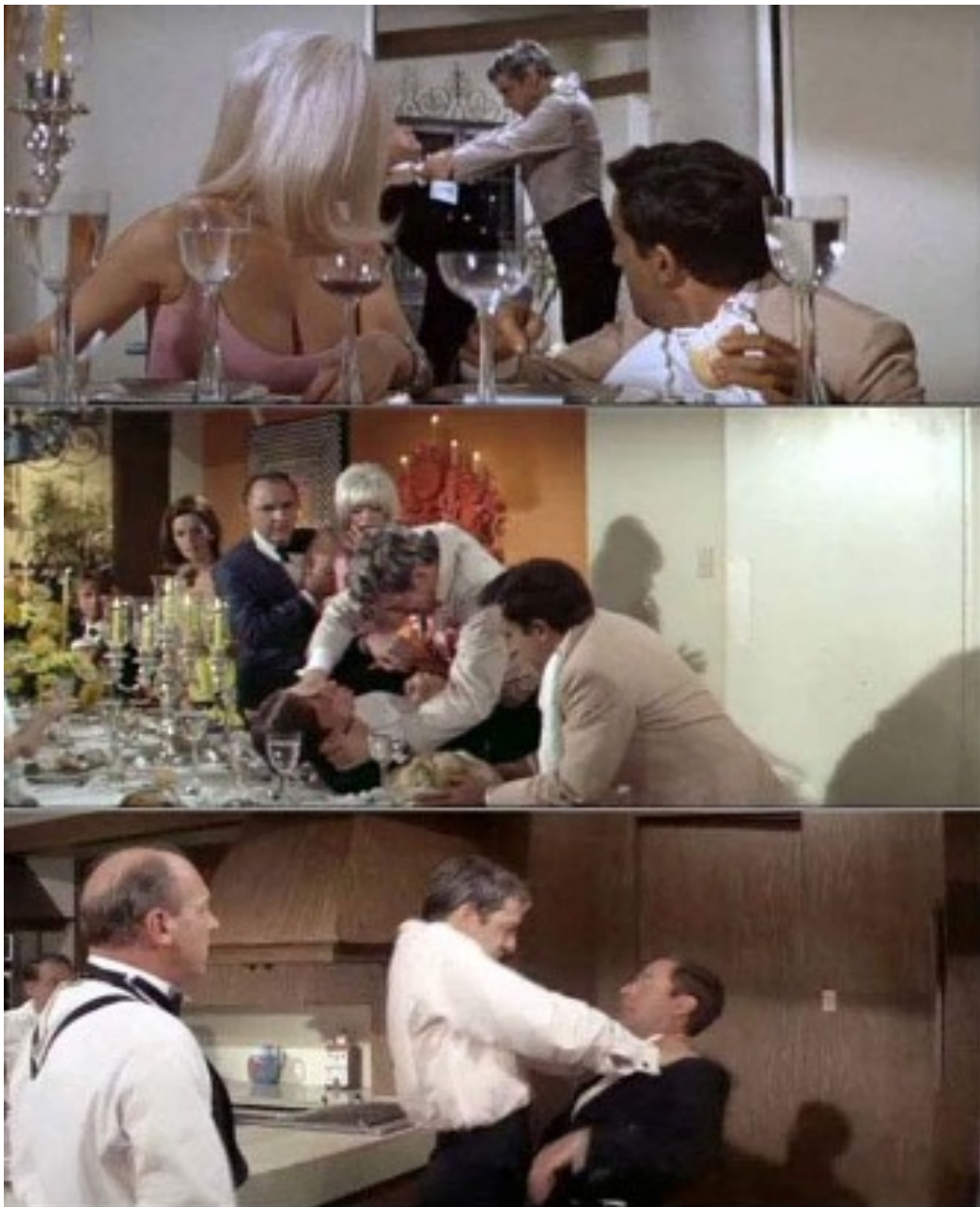
Figure 15. Trois tentatives d'étranglement du serveur...