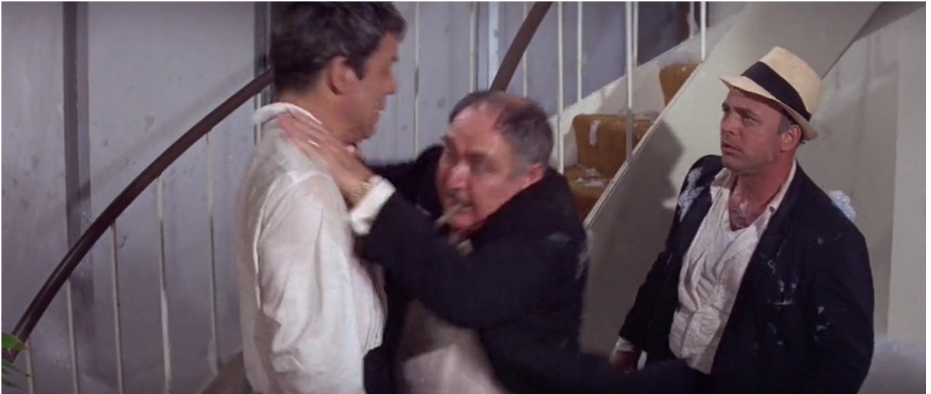
Figure 16. Retournement de situation.

Au final, ce sera lui qui se fera étrangler, par mégarde, par le producteur.