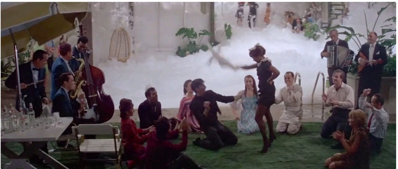
Figure 18. La serveuse noire mène la danse...

En effet, c'est à la fin que le long plan surprenant du début sur les jambes de la domestique prend tout son sens. La serveuse noire qui montrait un peu trop ses jambes et son postérieur (scène de la cuisine) dévoile son potentiel érotique et clôturera la soirée en reine du Motown , un Blanc à ses pieds. Le film signe ainsi la fin d'une suprématie ethnocentriste - et de la culture blanche (autrement dit, du WASP). La musique le dit : « The party gets groovy and everybody loses control ».