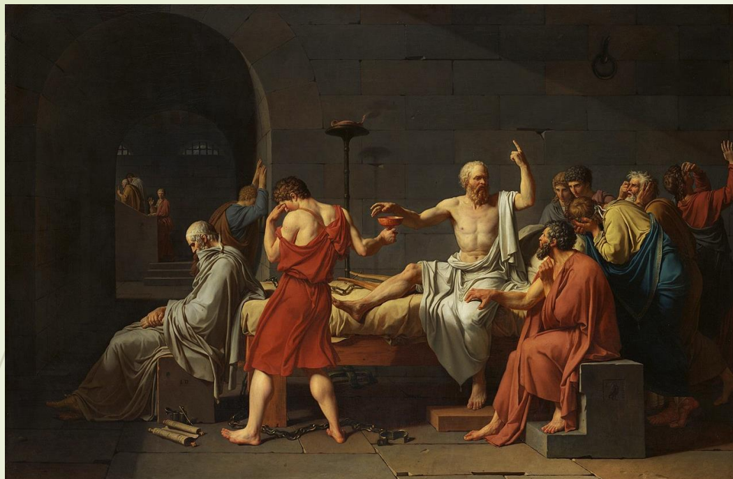
Mort de Socrate (1787) Jacques-Louis David Metropolitan Museum of Art New York City