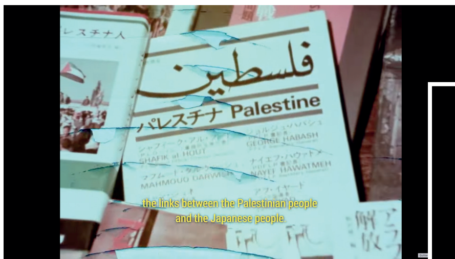
Le film R21 AKA Restoring Solidarity réunit des archives audiovisuelles sur la cause palestinienne conservées au Japon.