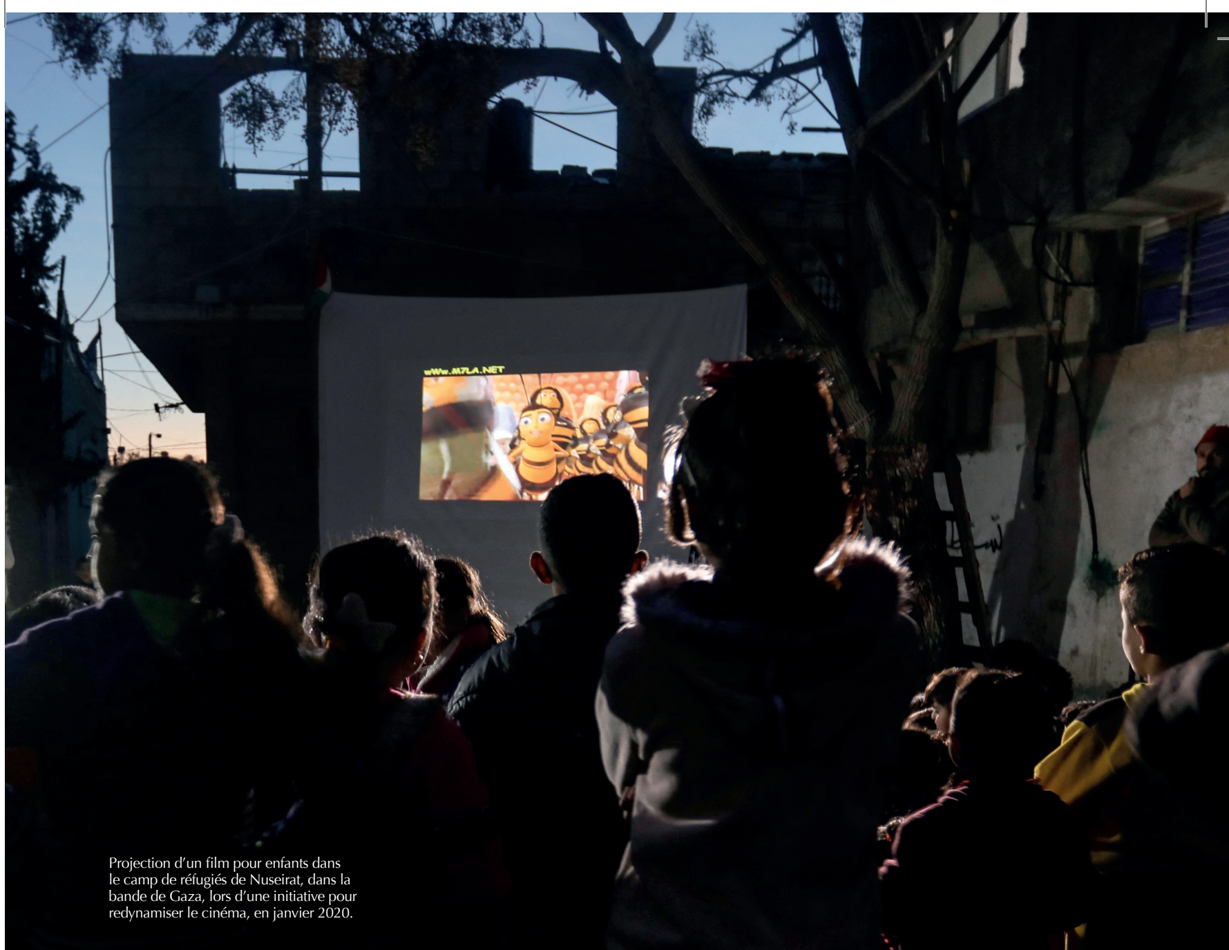
Projection d'un film pour enfants dans le camp de réfugiés de Nuseirat, dans la bande de Gaza, lors d'une initiative pour redynamiser le cinéma, en janvier 2020.