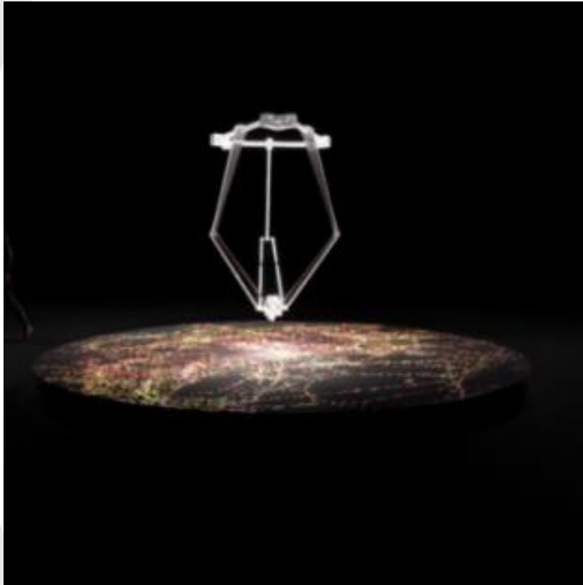
“Perpétuité II” Felix Luque Sanchez