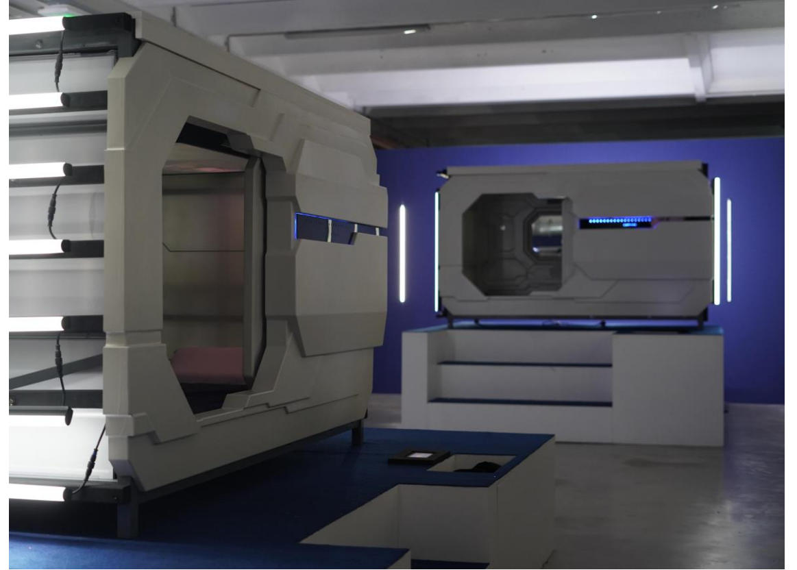
“Captive” Romain Tardy