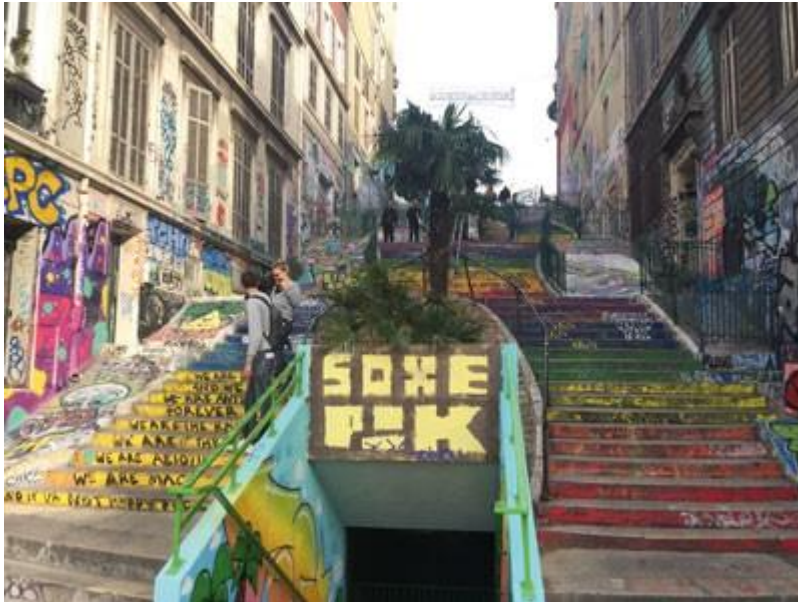
Escaliers du cours Julien, (rue Estelle)