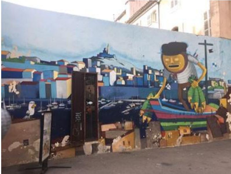
Street art sous forme de fresque, réalisée en 2014 par Nhobi et Seek à la Vieille Charité