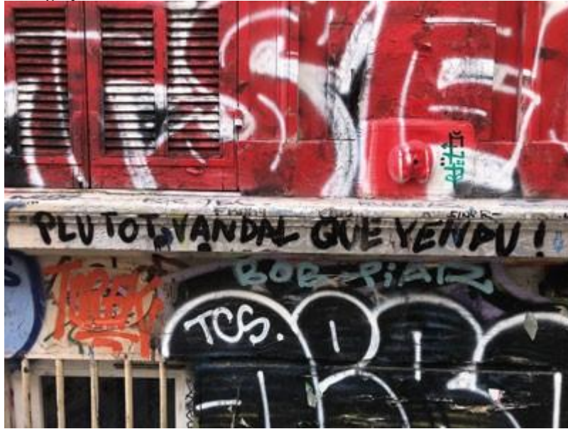
Street art vandale et politique