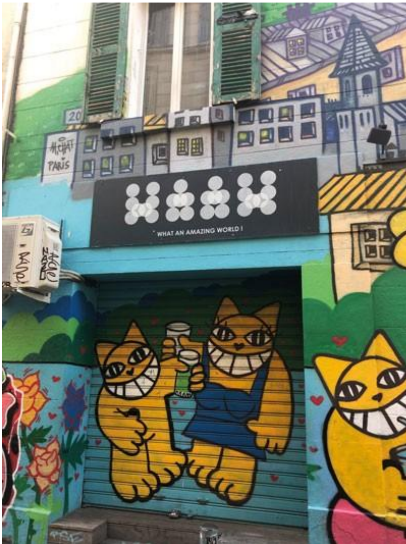
Devanture de commerce graphée