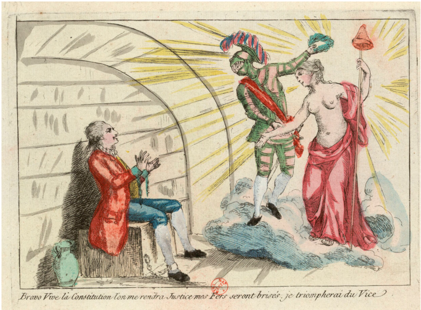
Anon., Bravo, Vive la Constitution! / l'on me rendra Justice / mes Fers seront brisés / je triompherai du Vice (1791), https://gallica.bnf.fr/ark:/12148/btv1b69481409 .