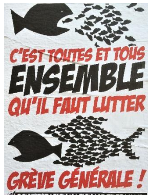
Figure 11 : Affiche CNT, Marseille, 2016