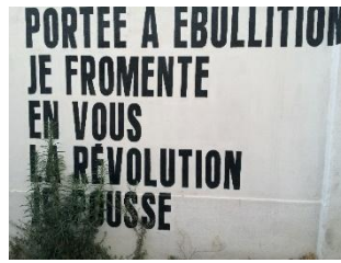
Figure 3 : Portée à ébullition , Le Couvent, Marseille, 2019