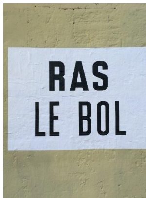
Figure 7 : Ras le Bol , Marseille, 2020