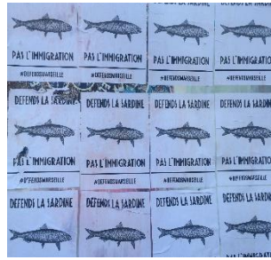
Figure 9 : Défends la sardine, pas l'immigration , Marseille, 2019