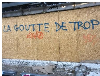
Figure 6 : La goutte de trop , Paris, 2023