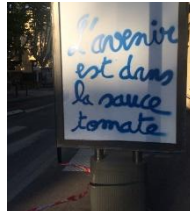
Figure 4 : L'avenir est dans la sauce tomate , Marseille, 2019