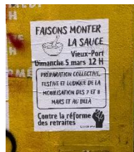
Figure 5 : Faisons monter la sauce , Marseille 2023