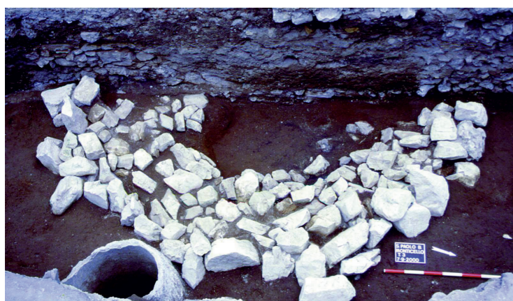
1. Capanna in corso di scavo Nola-Croce del Papa Bronzo antico evoluto