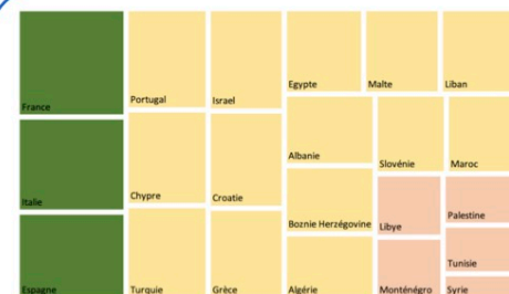
Taux d'imprégnation de l'économie de plateforme dans les pays du pourtour méditerranéen, Crédit : Gwénaëlle Dourthe, 2023

Nous concevons un indice d'ubérisation des pays méditerranéens composé de trois sous-indices : le sous-indice 1 mesure les facteurs qui favorisent le développement de l'économie de plateforme, le sous-indice 2 évalue l'imprégnation de cette économie dans les économies locales et le sous-indice 3 incorpore les réglementations ou interdictions qui en découlent. Cet indice a vocation à l'établissement d'une typologie méditerranéenne, voire à la réalisation d'un atlas de l'ubérisation.