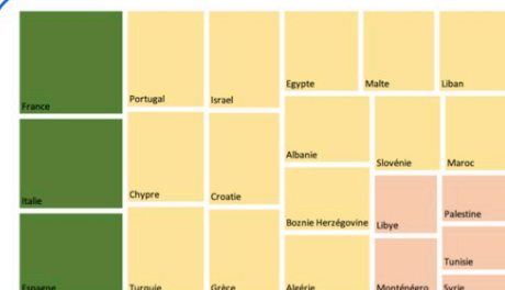
Taux d'imprégnation de l'économie de plateforme dans les pays du pourtour méditerranéen, Crédit : Gwénaëlle Dourthe, 2023

Nous concevons un indice d'ubérisation des pays méditerranéens composé de trois sous-indices : le sous-indice 1 mesure les facteurs qui favorisent le développement de l'économie de plateforme, le sous-indice 2 évalue l'imprégnation de cette économie dans les économies locales et le sous-indice 3 incorpore les réglementations ou interdictions qui en découlent. Cet indice a vocation à l'établissement d'une typologie méditerranéenne, voire à la réalisation d'un atlas de l'ubérisation.