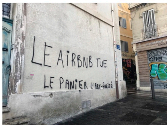
Graffiti « anti-Airbnb » dans le quartier du Panier à Marseille, Crédit : Alexandre Grondeau, 2022

Alexandre Grondeau et Gwénaëlle Dourthe (Aix-Marseille Université, TELEMME, Observatoire du développement local) 2023-2028