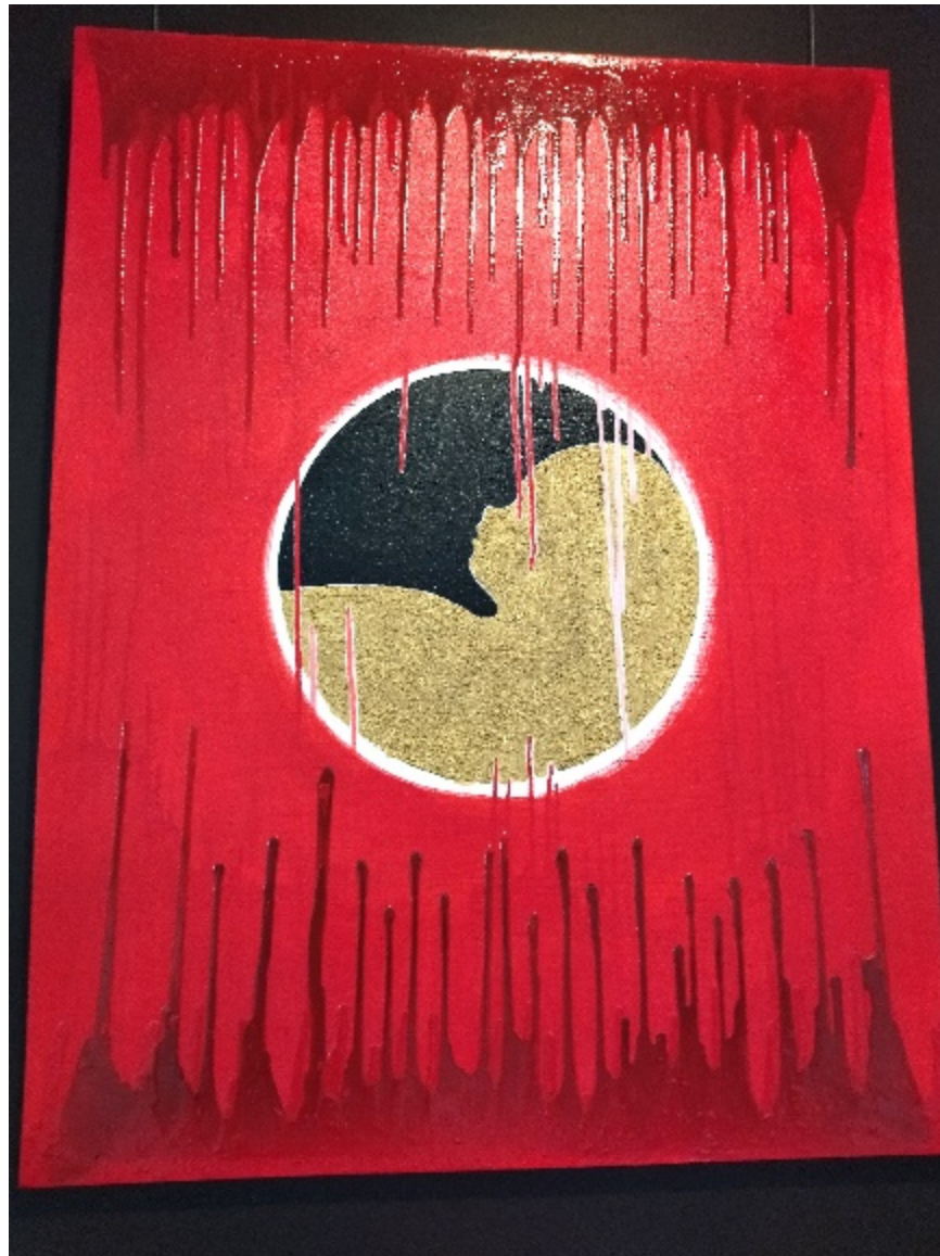
Tableau 2 : « La question »