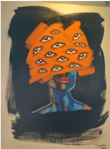
Tableau 3 : « Obsession »