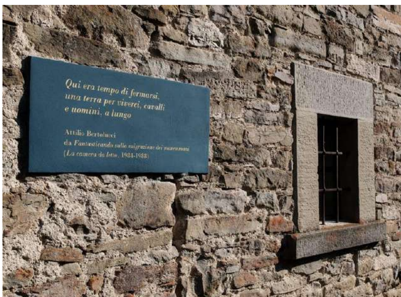
Fig. 1 : Plaque sur une façade de Casarola comportant des vers d'Attilio Bertolucci (ici un extrait du roman en vers La camera da letto ).

Casarola est aujourd'hui officiellement reconnu comme lieu de la mémoire littéraire du poète Bertolucci. La municipalité de Monchio delle Corti a créé le Comité Pro Casarola qui gère le centre La Casa delle Ciliegie, chargé d'organiser, entre autres, des initiatives autour de l'environnement et de la littérature, 27 comme le festival « Una terra per viverci », fondé en 2001, à savoir une journée estivale consacrée à la littérature et à la nature, qui part de la maison du poète pour effectuer une promenade-lecture et écouter des conférences et de la musique autour de son œuvre. Depuis 2017 la journée « Una terra per viverci » est associée au Workshop international d'architecture « La casa del poeta », organisé par l'École Polytechnique de Milan, qui s'occupe de la conservation du patrimoine local sous la forme d'un séminaire et d'un atelier.