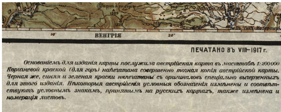
Droite de la marge inférieure, note sur la série

Jean-Luc Arnaud, Aix Marseille Univ, CNRS, TELEMME, Aix-en-Provence, France, mai 2016