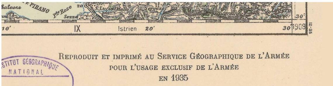
Droite de la marge inférieure, mention de responsabilité et date