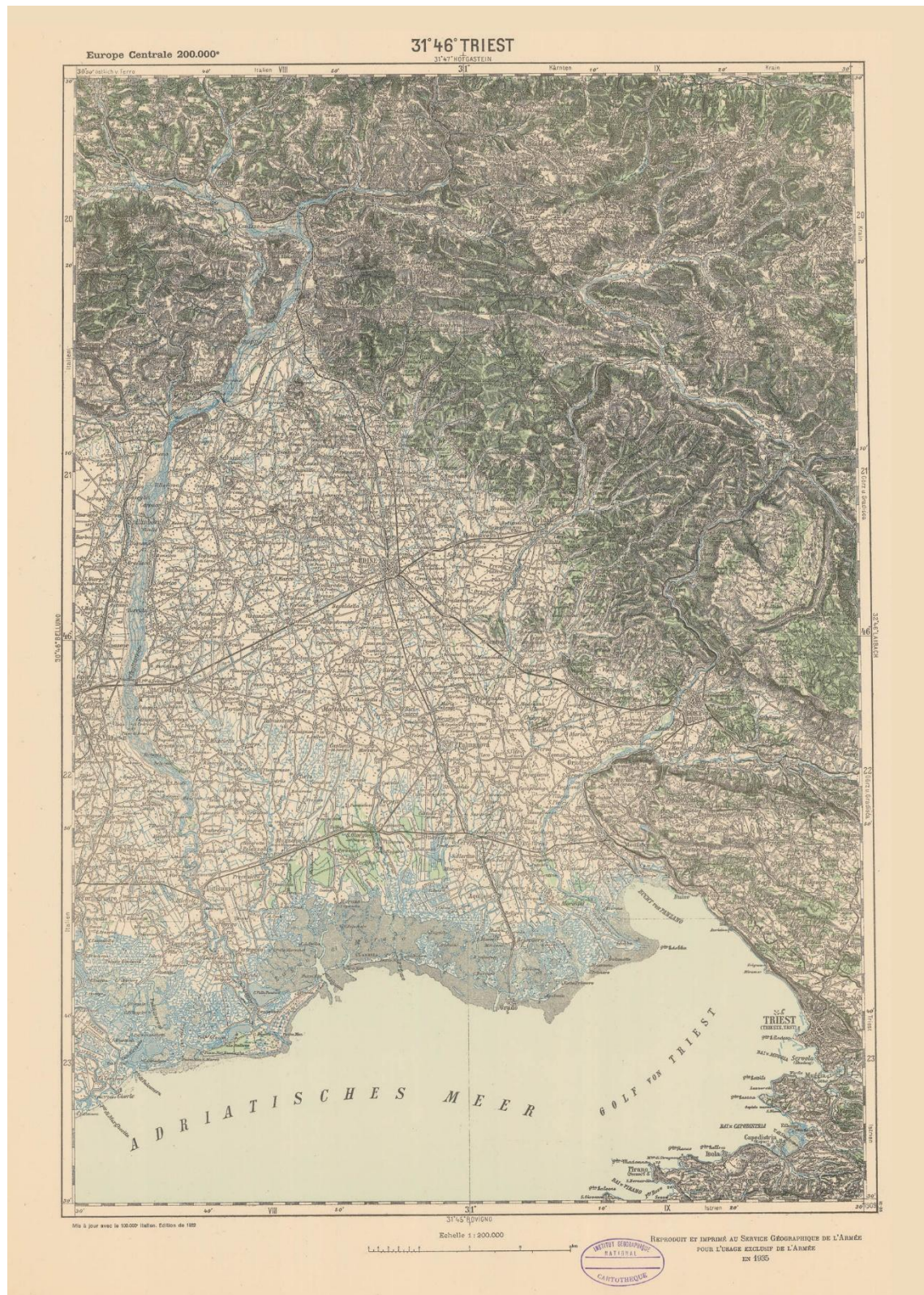
Feuille Triest – 31° 46', Paris, Service géographique de l'armée, 1935. Coll. IGN. Les extraits qui suivent, reproduits à l'échelle un, sont tirés de la même feuille.