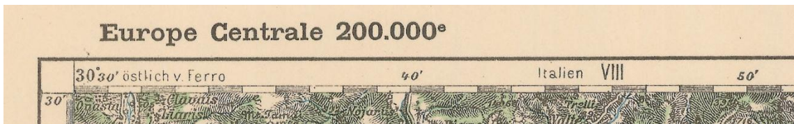
Gauche de la marge supérieure, titre de la série