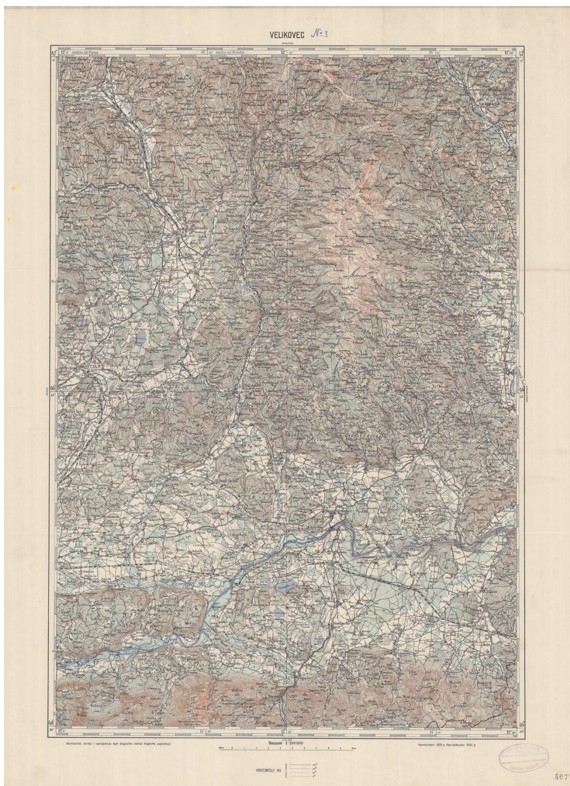
Feuille Velikovec , [Belgrade], Vojni Geografski institut Kraljevine Jugoslavije, 1934. Les extraits qui suivent, reproduits à l'échelle un, sont tirés de la même feuille.