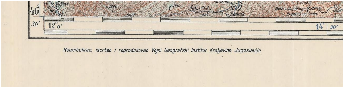
Gauche de la marge inférieure, mention de responsabilité