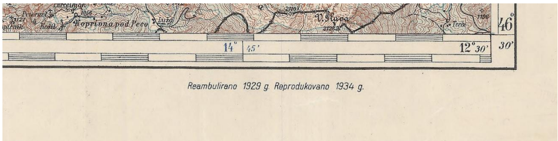
Droite de la marge inférieure, dates de mise à jour et d'impression

Jean-Luc Arnaud, Aix Marseille Univ, CNRS, TELEMME, Aix-en-Provence, France, mai 2016